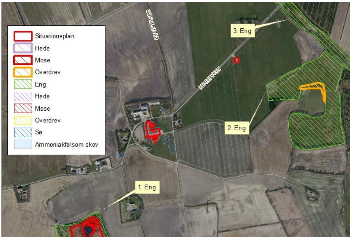
Figur 5. Kort over kategori 3 samt § 3 natur ved anlægget.

Merbelastningen til områderne er 0,0 kg N/ha/år og ligger under beskyttelsesniveauet på 1,0 kg N/ha/år i merbelastning. Der er ikke foretaget beregninger af ammoniakdeposition til øvrige naturarealer, da Vejen Kommune vurderer, at naturarealer, der ligger længere væk end de i tabellen nævnte naturarealer, ikke vil blive belastet med over 1,0 kg N/ha/år.