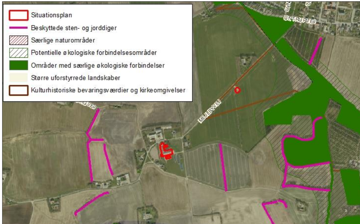
Figur 2. Anlæggets placering i landskabet.