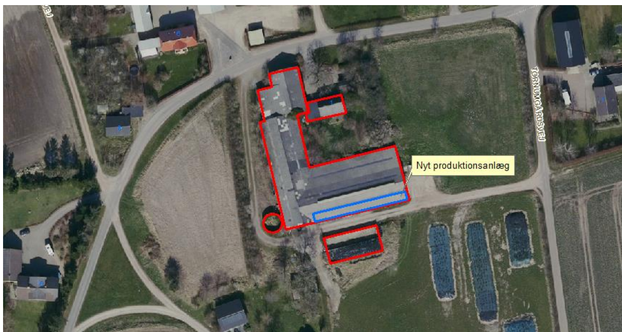
Figur 3. Blå markering viser nye inddraget produktionsareal i eksisterende stald.

For §§ 6 og 8 gælder, at der ikke må ske etablering af anlæg eller udvidelser, der medfører forøget forurening inden for afstandskravet. For § 7 gælder, at der ikke må ske nyetablering indenfor afstandskravet.