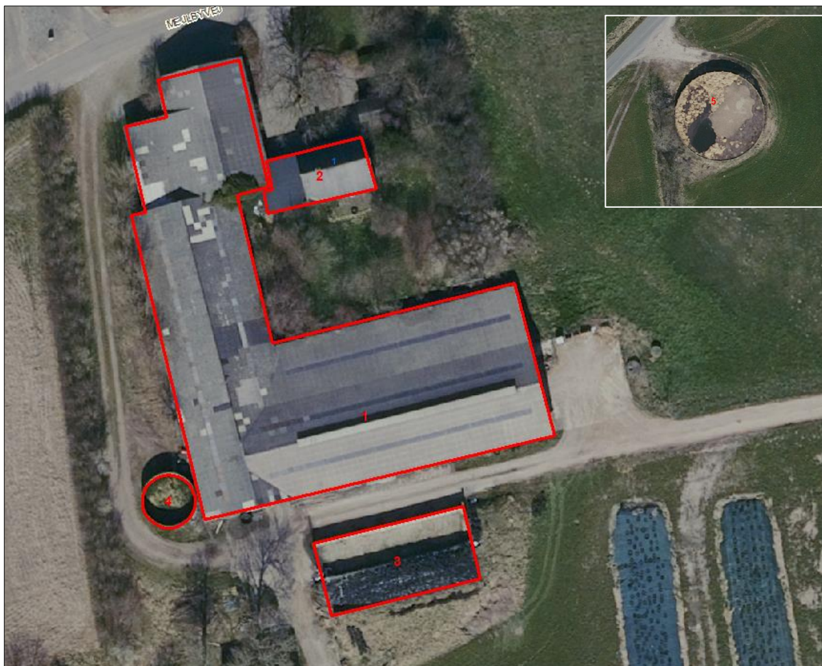
Figur 1. Husdyrbrugets driftsbygninger – beholder (5) er placeret ca. 500 m. nordøst for ejendommen.

Figur og tabel herunder viser den fremtidige bygningsanvendelse på ejendommen.