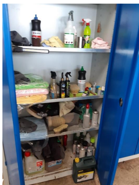
Figur 1b Skab til vaskeprodukter og lign.