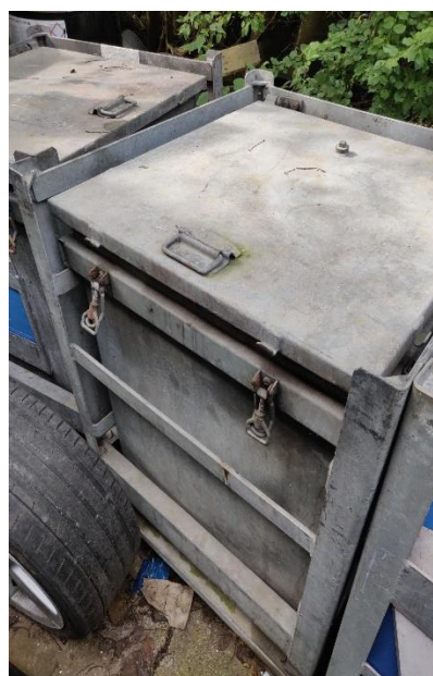
Figur 3ab Opbevaring af flydende farligt affald uden overdækning.