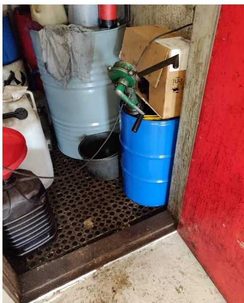
Figur 1a Aflukket rum til spildolie og flydende råvarer