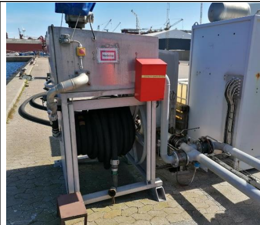
Kaj-anlæg (SØS anlæg)