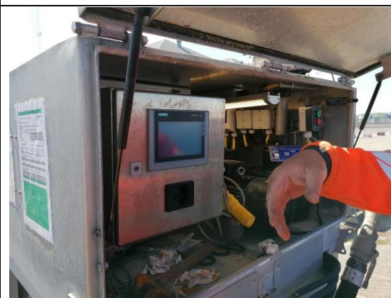
Manuel styring af kaj anlæg.