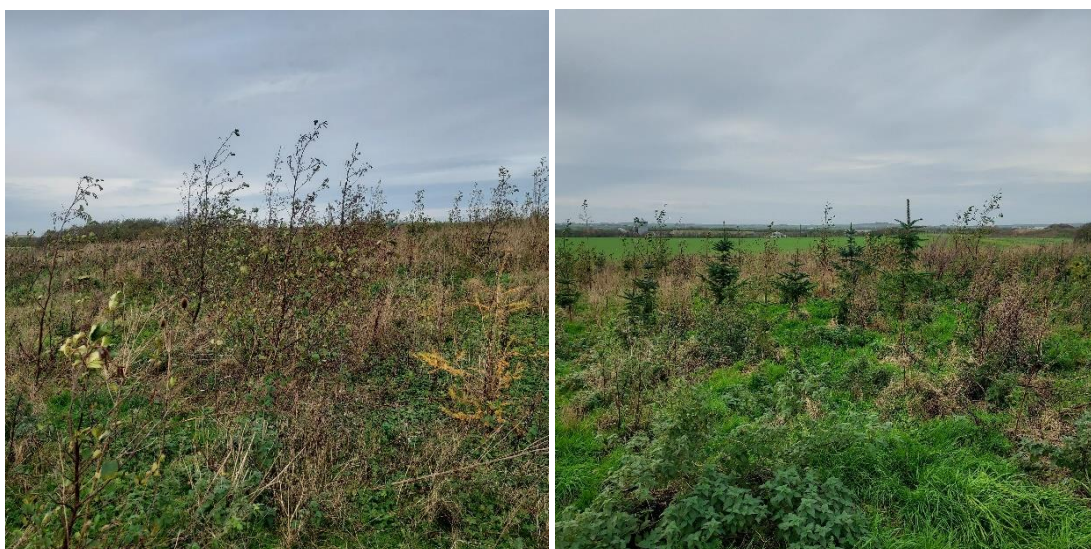
Figur 1. Bevoksning, buske og småtræer på etape 5.

I/S Skovsted Losseplads oplyste, at beplantningens tilstand er påvirket af vintersæsonen, idet løvet er fældet af de små planter. Ligeledes gnaves/spises beplantningen af vilde dyr i området, som ses på figur 2. Miljøstyrelsen følger op behov for nødvendigt omfang genplantes.