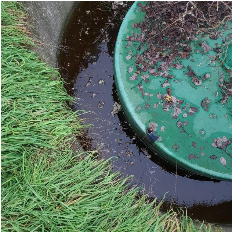
Figur 4. Brønden på etape 5.

Der blev observeret stillestående vand i betonbrønden, som evt. kan kontaminere brøndens indhold.