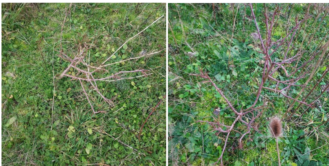
Figur 2. Fotos der viser beplantningens tilstand pr. 8. november 2022 på etape 5.

På den tildækkede etape har været opsat markeringspæle for asbest-cellen. Det har ikke været muligt, at lokalisere en af de fire markeringspæle for asbestcellen på etape 5.