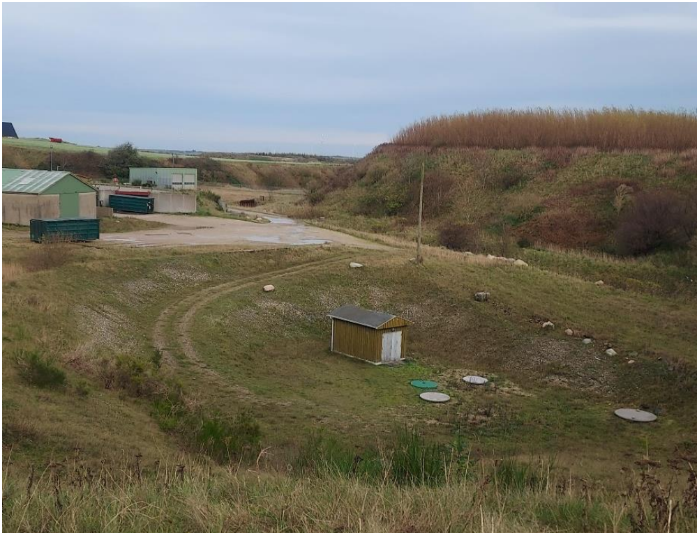
Figur 7. Pumpehuset i midten og afløbsbrøndene fra deponiets etaper.

Perkolatsystemet inklusive perkolatbrøndene og perkolatpumpe blev besigtiget. Der blev aftalt, at I/S Skovsted indsender kloaktegninger for perkolatsystemet og afledning af overfladevand.