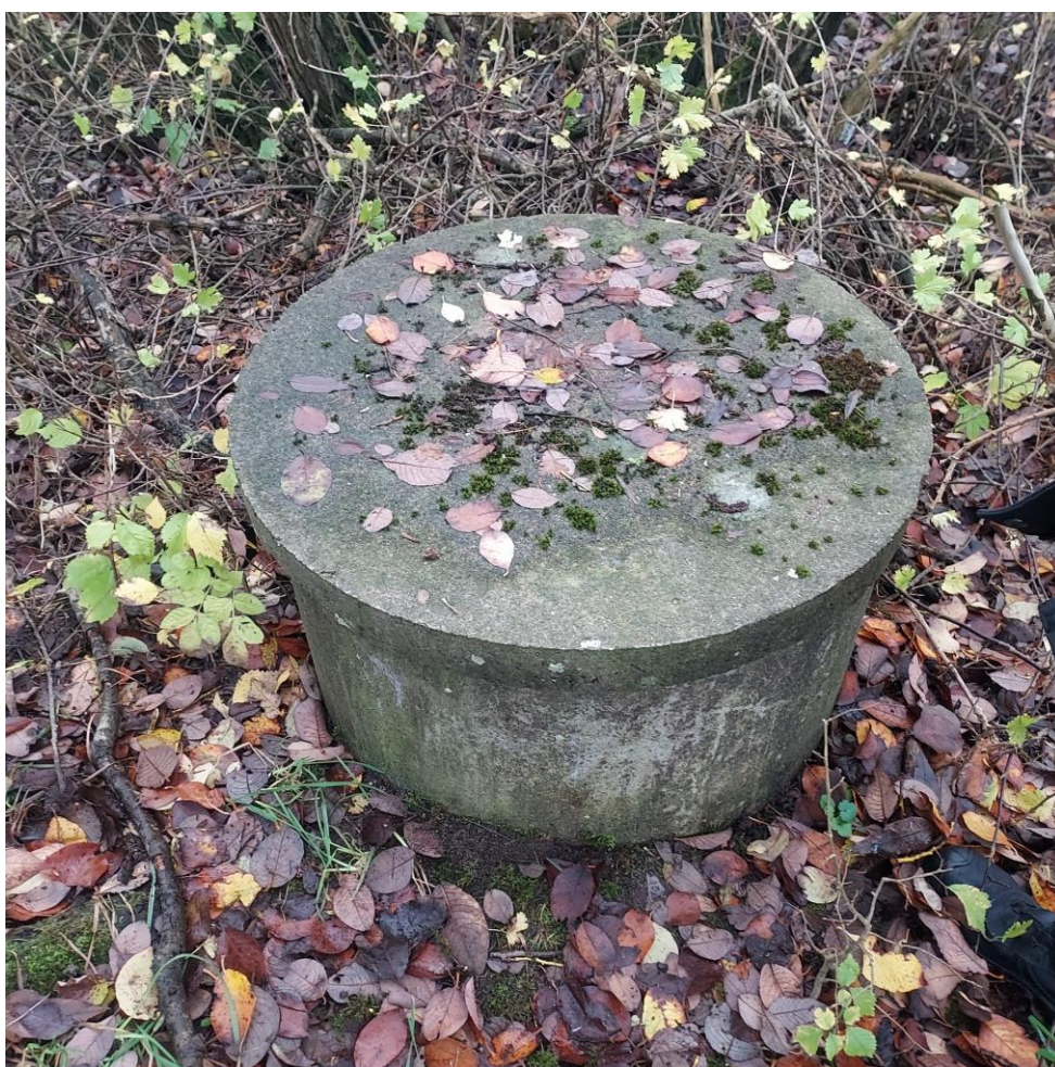
Figur 9. Monitoringsboring DGU nr. 30.905 (K6)

Ved tilsynet blev grundvandsmoniteringsboringen K6 (Nedstrøms) besigtiget. Miljøstyrelsen har ingen bemærkninger til det.