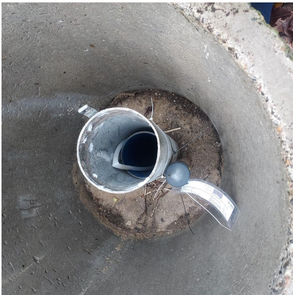
Figur 10. Grundvandsmoniteringsboring DGU nr. 30.905 (K6)

Der er 2 indtag i betonbrønden. Et \varnothing 125 mm med metalafslutning samt et \varnothing 50 mm med PVC prop. Begge to har vandtæt boringslabels med DGU nr. Miljøstyrelsen understregede vigtigheden af lås for at undgå kontaminering af borerne.