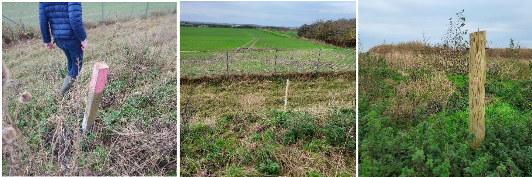
Figur 3. 3 af de 4 markeringspæle for asbestcellen på etape 5.

Der er ved besigtigelse af etape 5 observeret en brønd uden entydig mærkning. Der blev aftalt, at I/S Skovsted Losseplads skal afklare, om brønden som ses på figur 4, er samlebrønden fra etape 1-4.