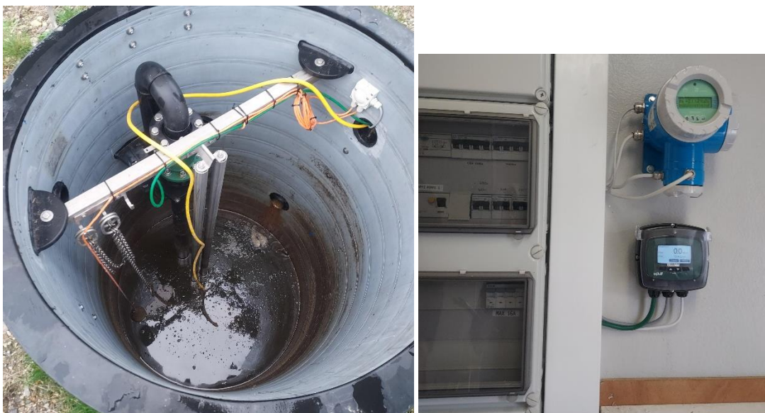
Figur 8. Afløbsbrønde og flovmåler

I/S Skovsted har d. 3. december 2021 oplyst, at der er sat vandur på udledningen fra omlastepladsen, således at vandmængden fra omlastepladsen kan adskilles fra vandmængden på de øvrige arealer, som ses på figur 8.