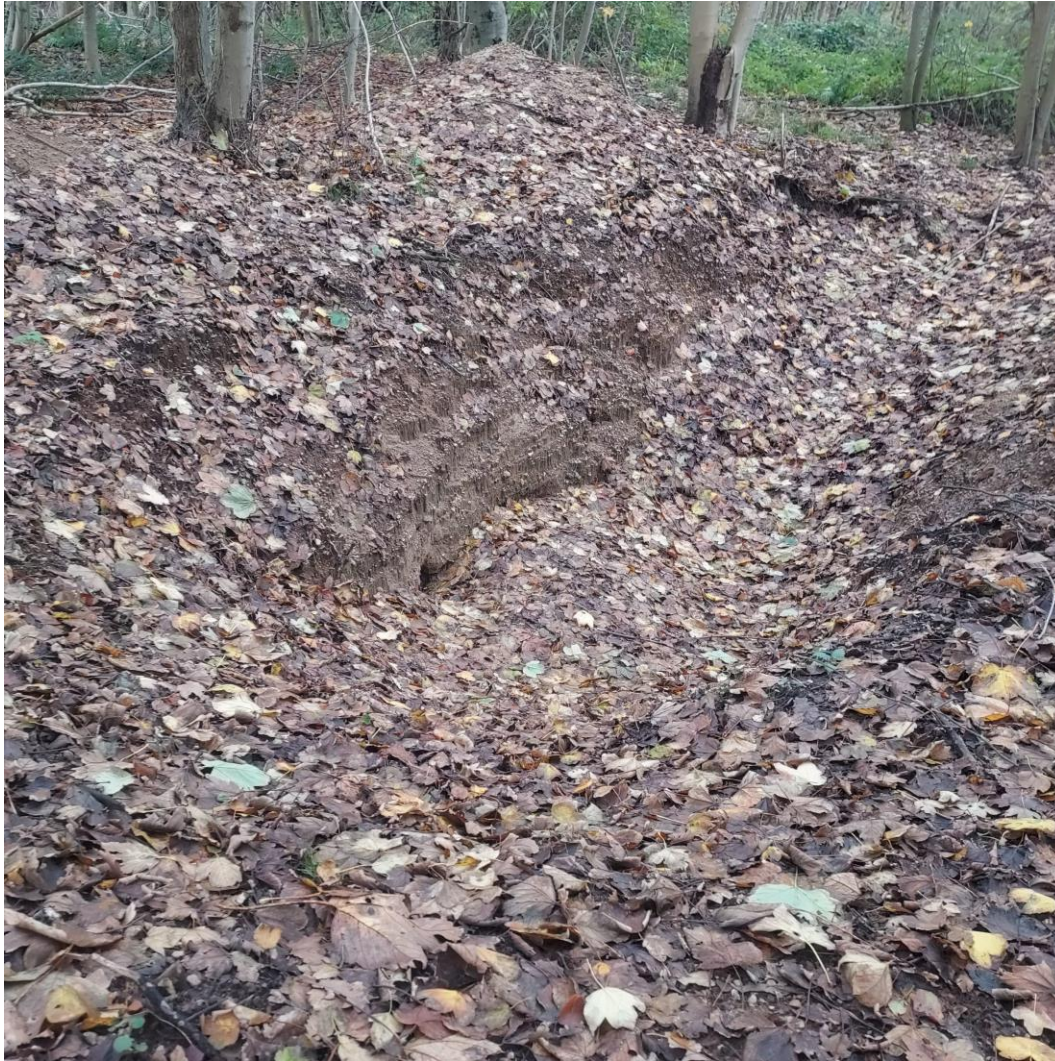
Figur 11. Tegn på maskingravninger