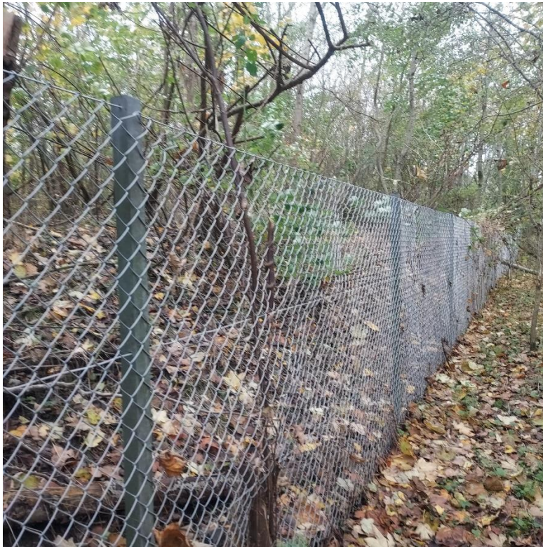
Figur 6. Hegnet, som ses udenfor deponiets grund (etape 1-2). Hegnet fremstår i god stand.