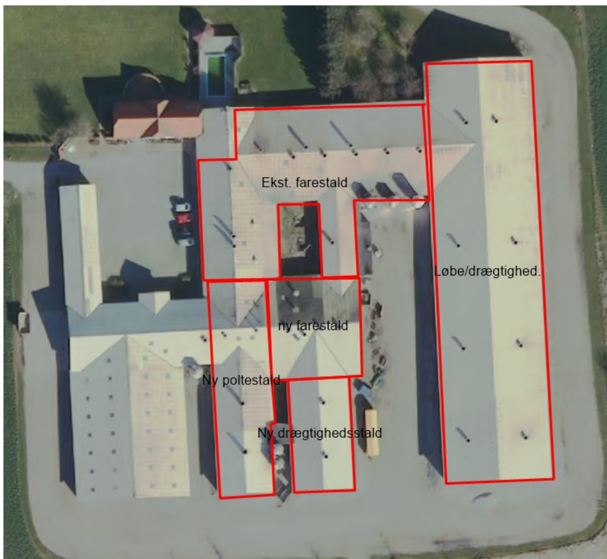
Luftfoto 2020 med indtegningen af stalde i revurderingsskema 223993.

Brønderslev Kommune har foretaget beregningerne vedrørende ammoniak igennem www.husdyrgodkendelse.dk i revurderingsskema nr 223993. Skemaet er skabt ved at overføre data fra det oprindelige skema 9976, hvorefter indtegningen af stalde og gylletanke er tilrettet.