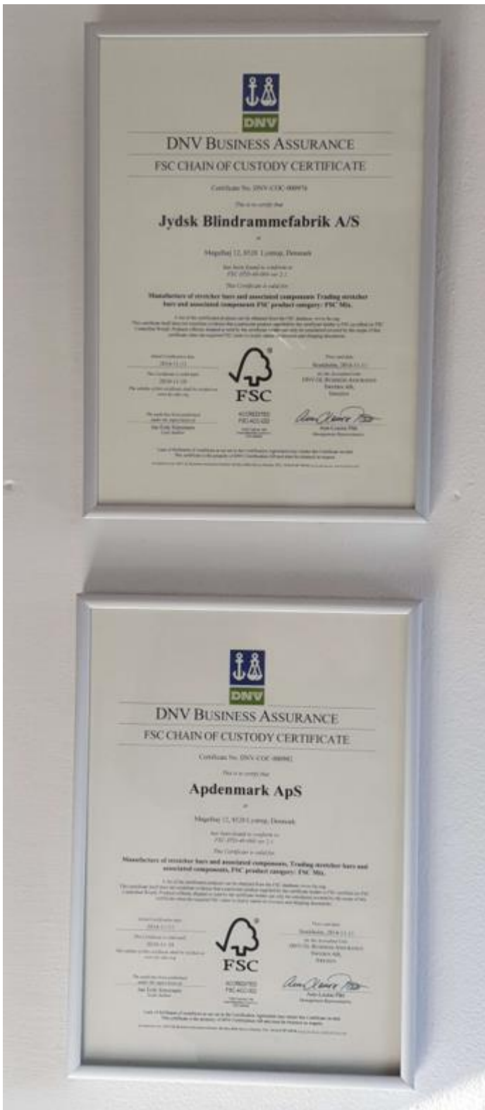
Certifikat for FSC Mix.