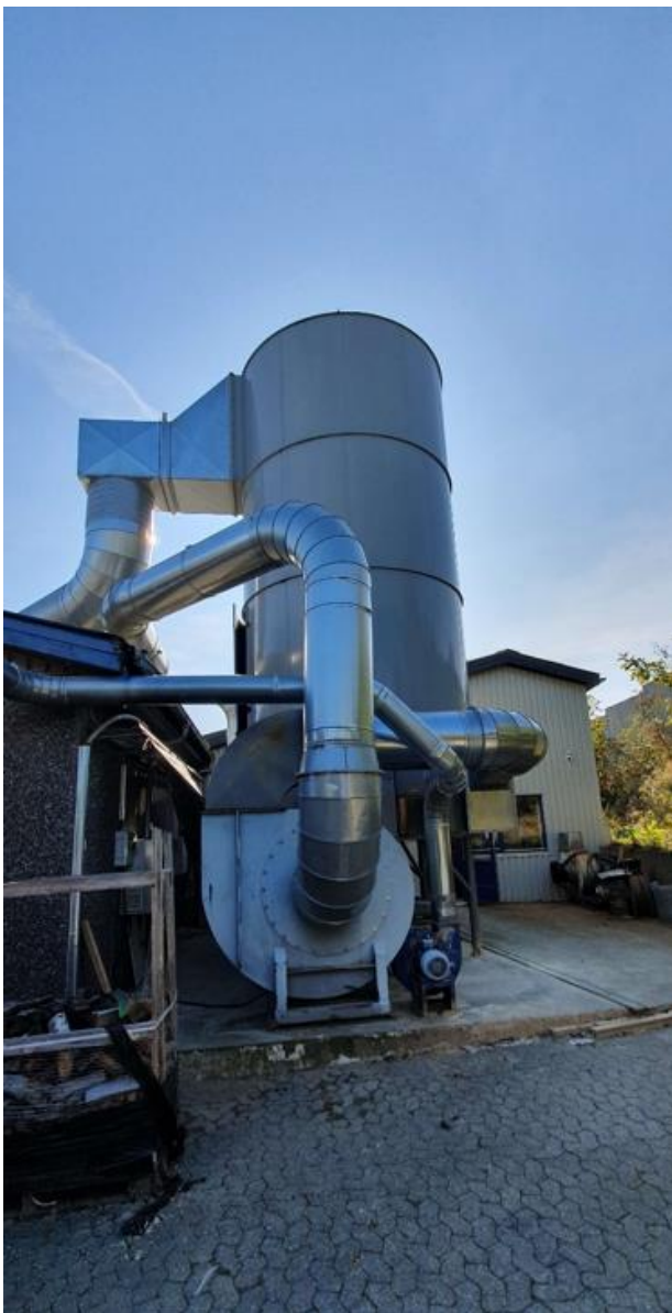
Spånsugningssystemet med posefilteranlæg i "siloen".