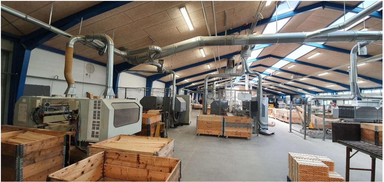
Produktionshallen med rørføringer til spånsugningssystemet.