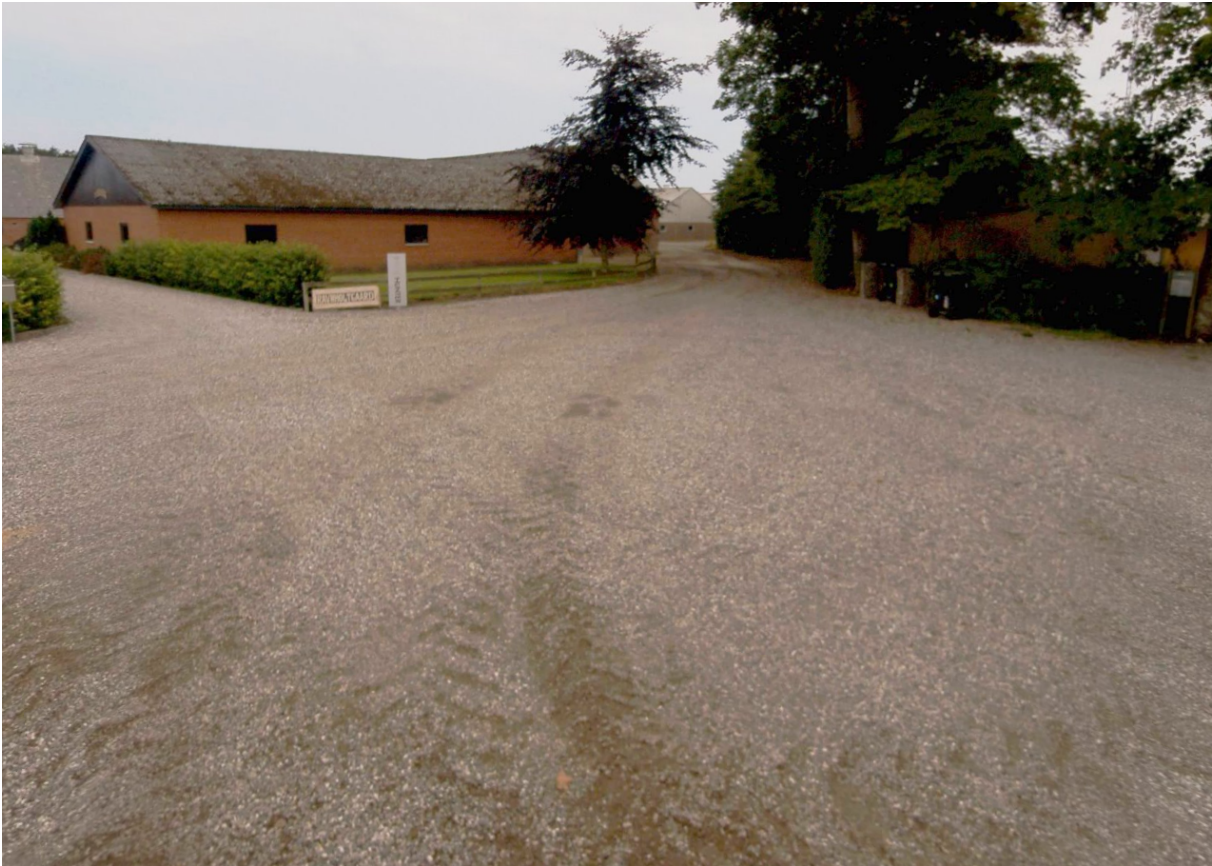
Figur 3. Udsyn fra Tingvadvej, 7130 Juelsminde.

Bag træer og eksisterende bygning ses gavlen på laden, der stod indtil ultimo 2023. Træer og bygninger blokerer delvist for udsyn til maskinhuset, hvor man fra vejen kun kan se gavlen, som vil stå længere fra vejen end laden gjorde.