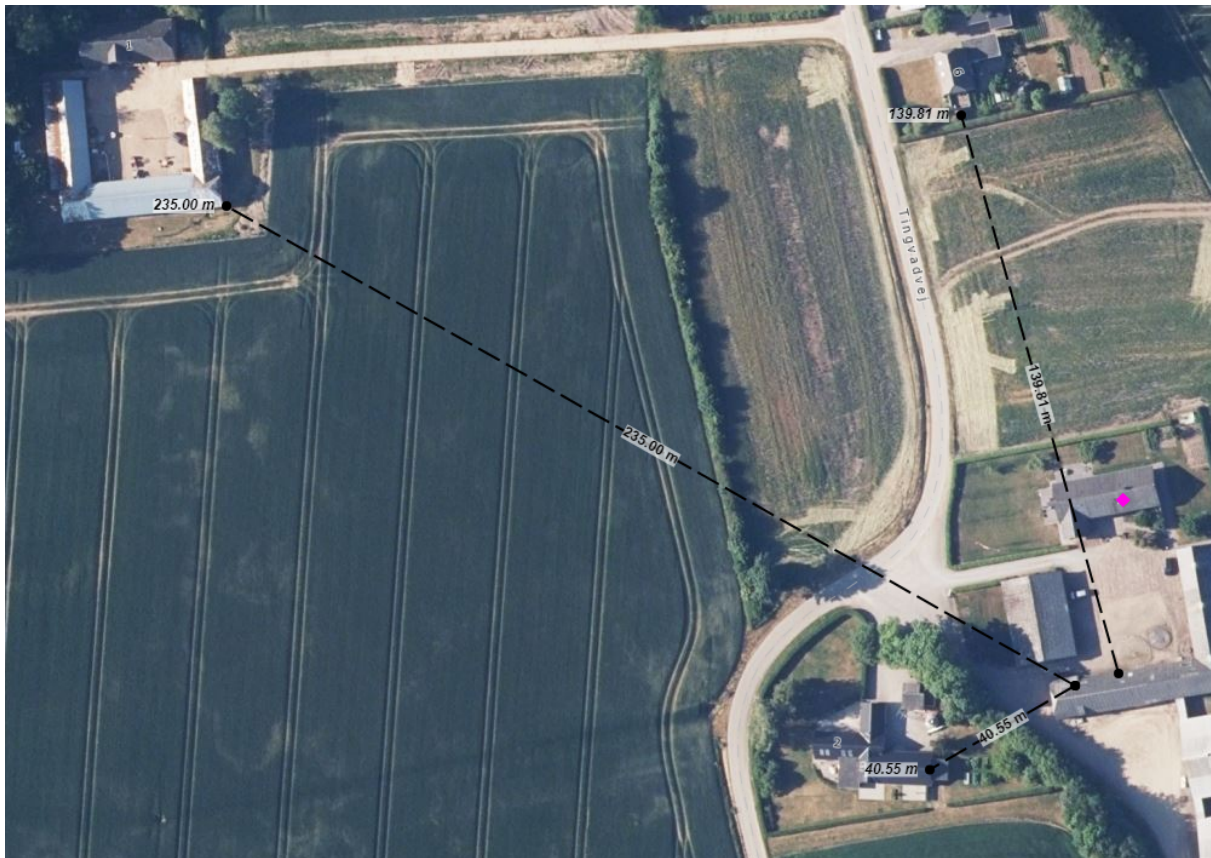
Figur 2. Oversigt over Tingvadvej 4, 7130 Juelsminde og tætteste naboer.

Tingvadvej 2 er beliggende cirka 41 m væk bag en række træer. Tingvadvej 1 og Tingvadvej 6 er beliggende henholdsvis 235 m og 139,8 m fra maskinhuset.