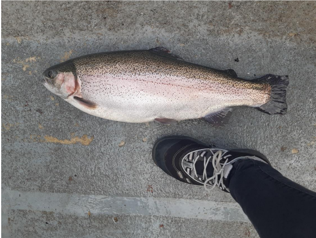
Figur 2: Dødenettets indhold på Fejø Havbrug.