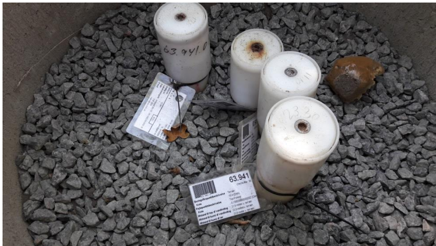
Figur 3 Filter 4 er ikke i brug i måleprogrammet.