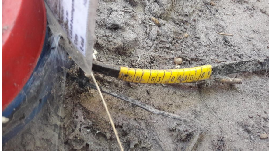
DGU nr. 63.828