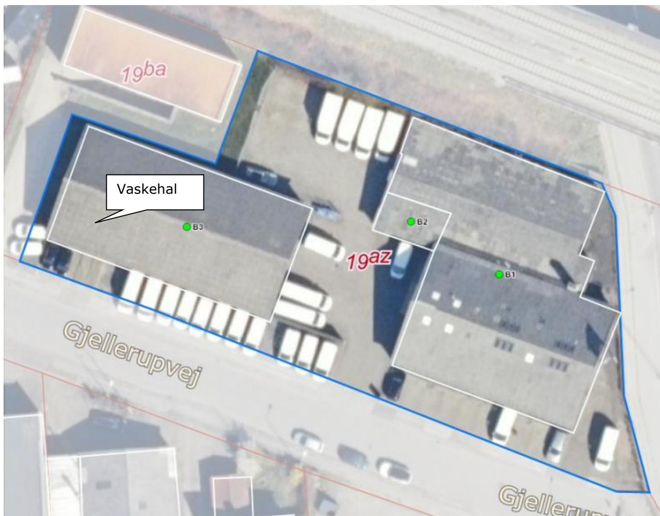
Luftfoto af virksomheden med matrikelskel fra BBR

I forhold til kommuneplanen ligger virksomheden i erhvervsområde 150513ER, der er udlagt til erhverv, og som er omfattet af lokalplan 116. Virksomhedens vaskehal ligger mindre end 100 meter fra bolig.