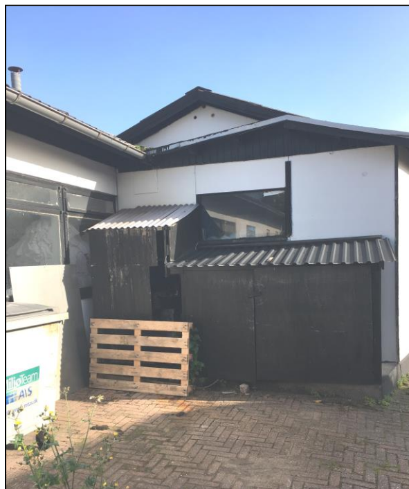
Foto til højre af kompressoren, der er placeret i skur udendørs. Skuret er ikke isoleret og støj fra kompressoren kan tydeligt høres.