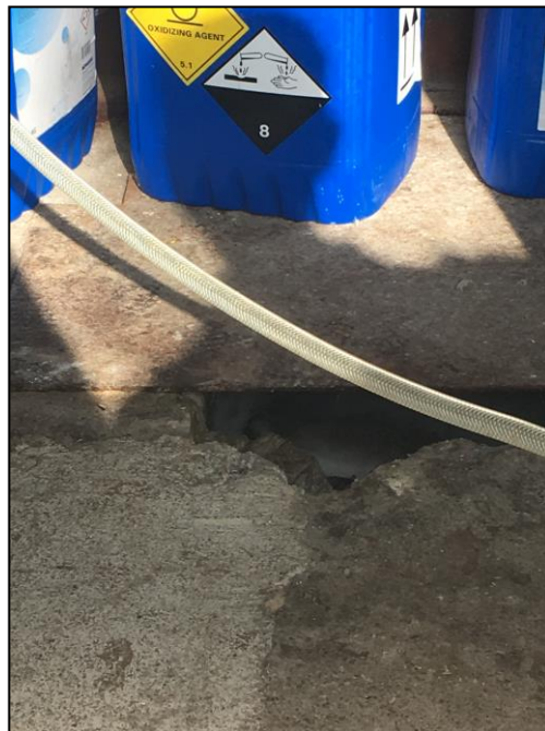
Foto til højre viser en sprække i betongulvet, som leder til nedgravet IBC-tank, der tømmes regelmæssigt ved opsug. Tanken blev i sin tid nedlagt til opsamling af sand fra aktiviteten med at rense måtter. Dette foretages ikke længere og tanken er sjældent fyldt.

Det oplyses, at Gunnar foretager prøver jævnligt også for at tilse, at produktionen er maksimal, idet maskinerne kun fungerer med blødt vand (hårdhed 19)