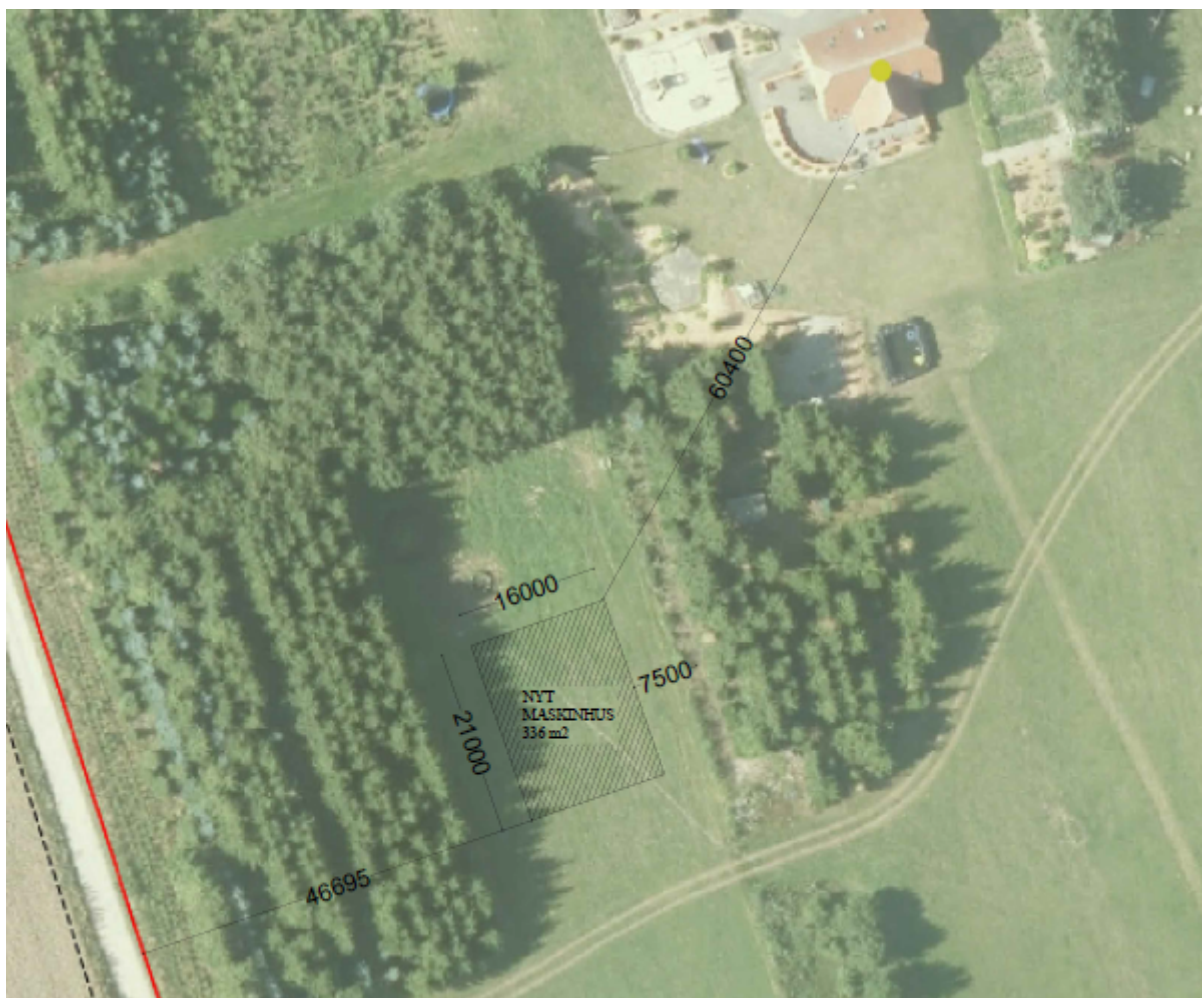
Fig. 2. Placering af maskinhus i forhold til eksisterende bebyggelse.