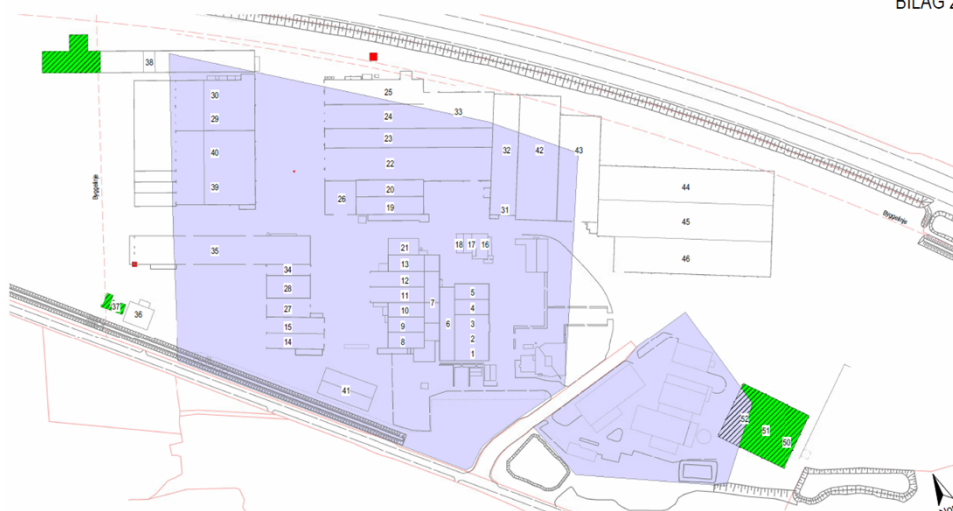
Figur 1 – Påtænkte udvidelser/ændringer på virksomheder markeret med grønt