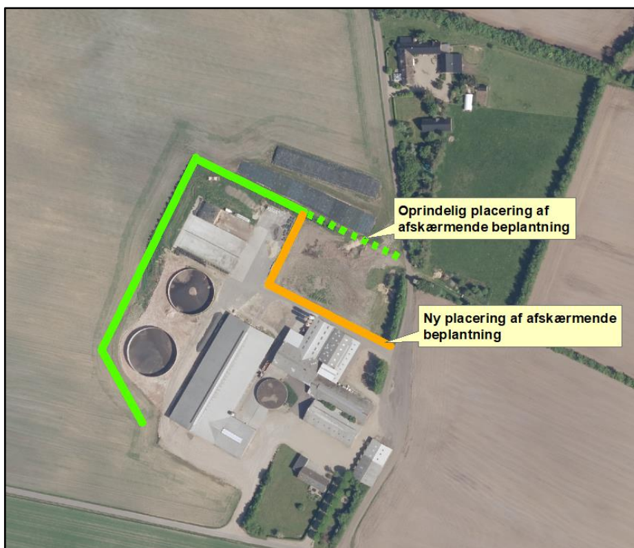
Figur 1. Ændringer i forhold til MGK2014