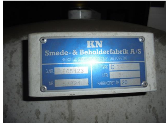
Fabrikeret år: 2013, LTR. 5.900