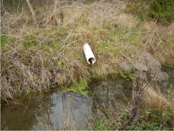
7. Udløb fra parkeringsplads ved Limpopoland.