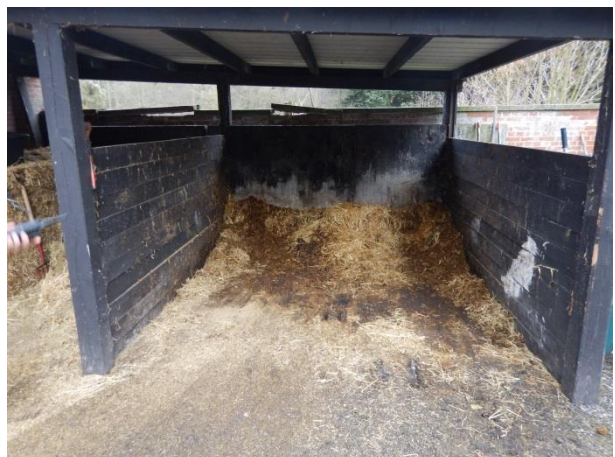
12. Mødding ved næsehorn.