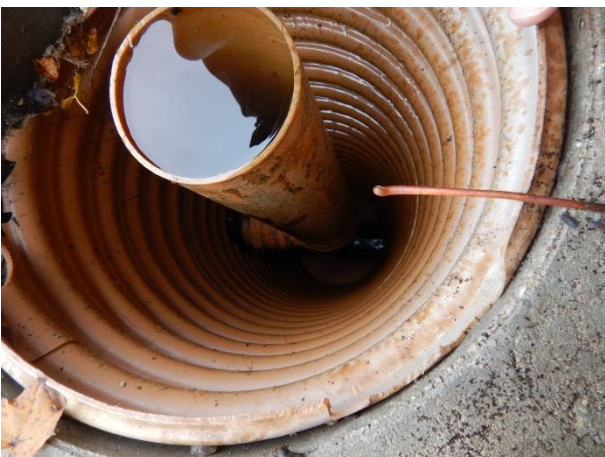
11. Overløbsbrønd fra sø i Limpopoland.