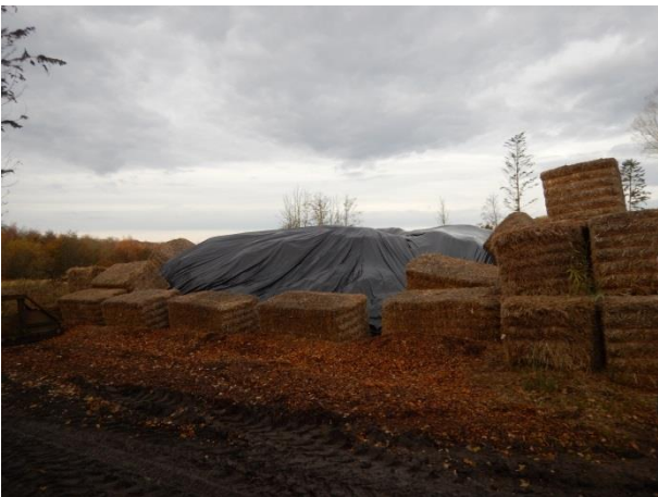
3. Sidste års markstak - overdækket.