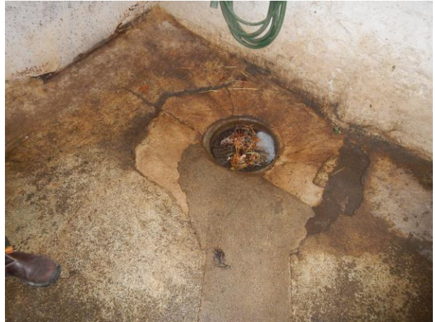
14. Afløb i slagtehus.