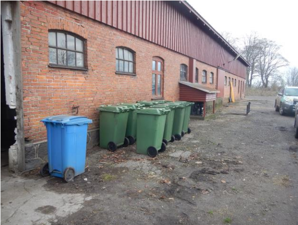
13. Affaldscontainere ved slagtehus.