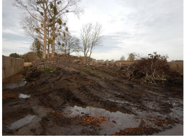
2. Komposteringsplads til højre for markstakken.