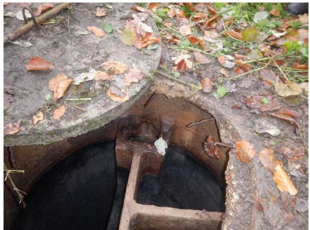
6. Overløbsbrønd ved tigerhuset.