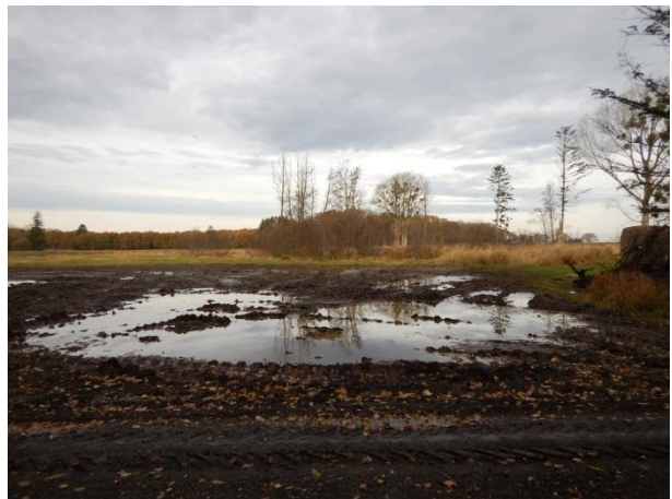
4. Muligvis areal til næste års markstak.