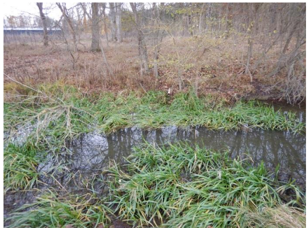
10. Udløb fra girafferne.