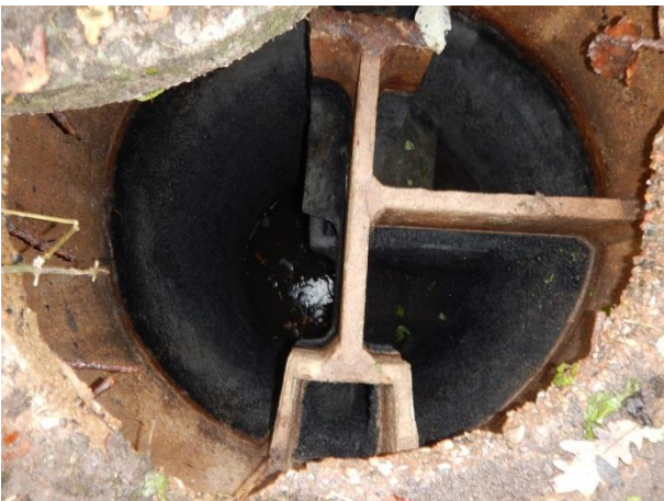
5. Overløbsbrønd ved tigerhuset.