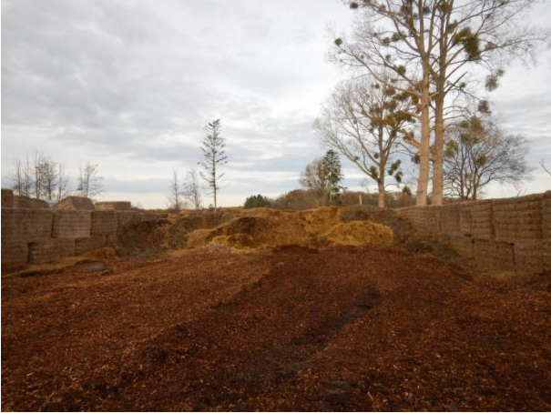
1. Nuværende markstak.