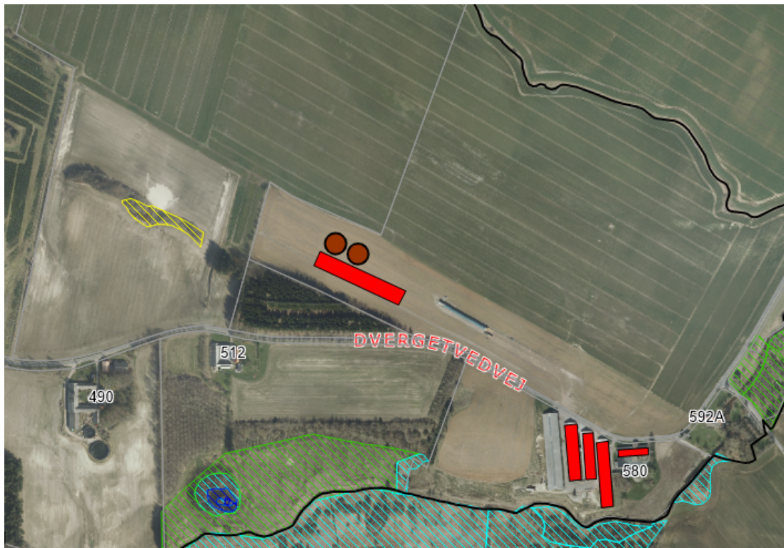
Figur 2: Endelig placering

Hjørring Kommune har konstateret, at det anmeldte overholder bekendtgørelsens krav og vurderet, at den anmeldte gyllebeholder ikke kræver miljøgodkendelse 1 . Anmeldelsen er behandlet i henhold til Bekendtgørelse om tilladelse og godkendelse m.v. af husdyrbrug 2 .