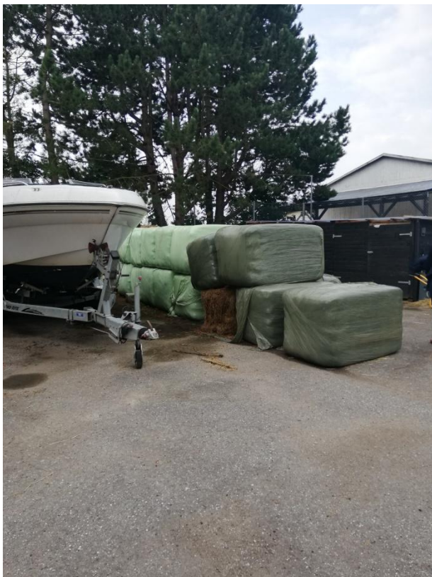
Figur 4: oplag af halm i plastfolie på asfalt