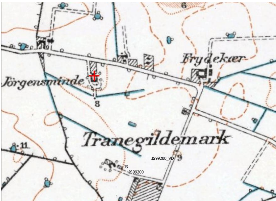
Figur 2: Topografiske kort over tidligere åbne afvandringsgrøfter nu lagt som dræn i området