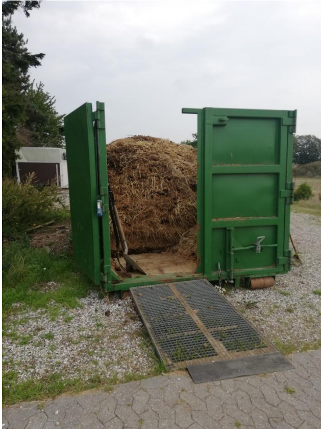
Figur 3: Container på grus uden overdækning