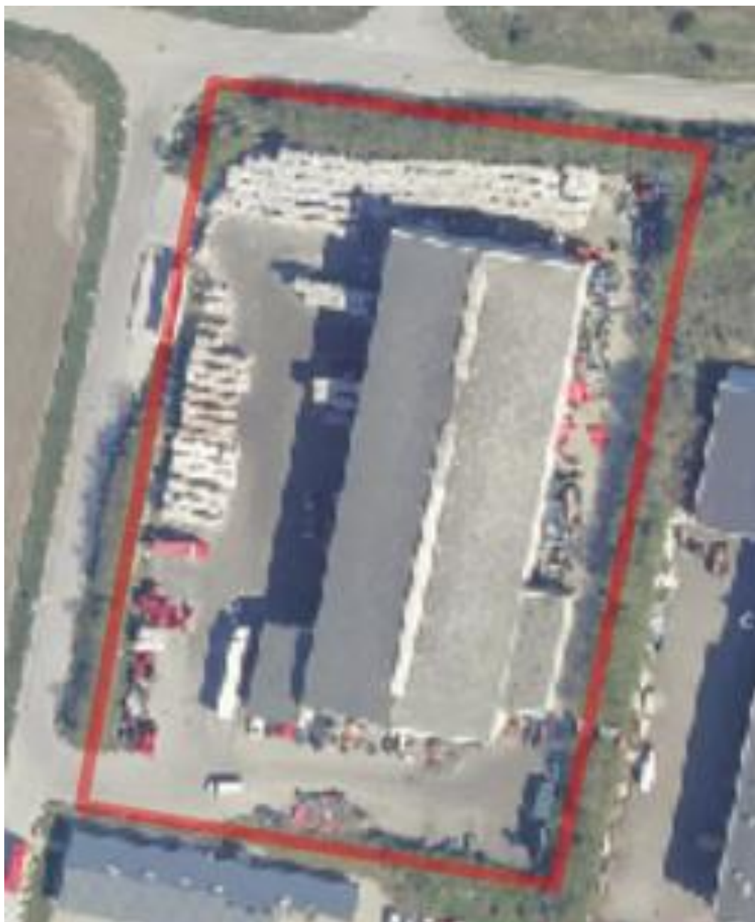
Billede 1. Høgemosevænget 17, 8380 Trige er markeret med rødt på ovenstående kort.

Virksomheden ligger i erhvervsområde 360220ER, der er omfattet af lokalplan 27, se nedenstående luftfoto.