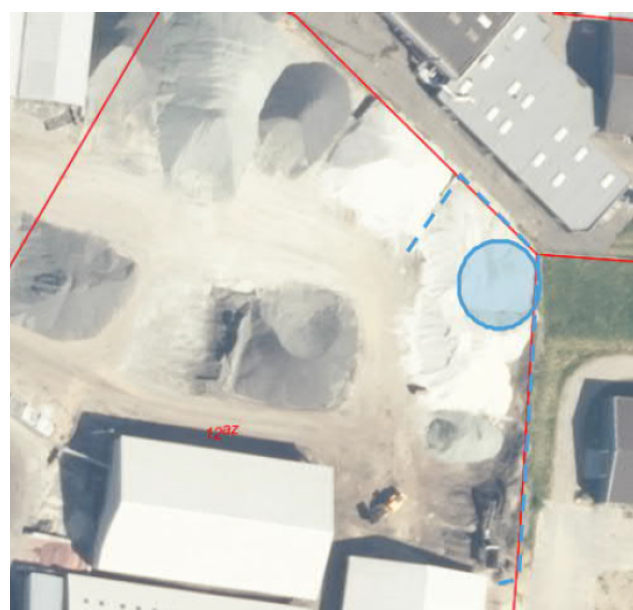
Alternative placeringer af nedknusningsområde nr. 1 til venstre og 2 til højre.