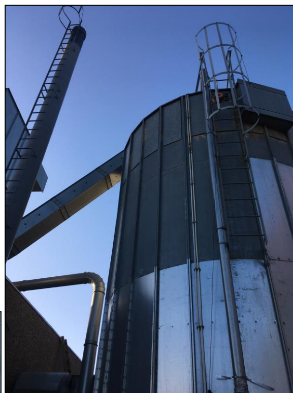
Foto af spånsilo herover og plastsække med spåner til venstre.

Der er fast serviceaftale med Multiair på spånsugningsanlægget.