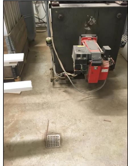
Foto af fyrrum med afløbsrist der leder til olieudskiller. Trykbeholderen er udskiftet siden sidste tilsyn.

./.. Kvitteringen for det årlige eftersyn af fyret bedes eftersendt.