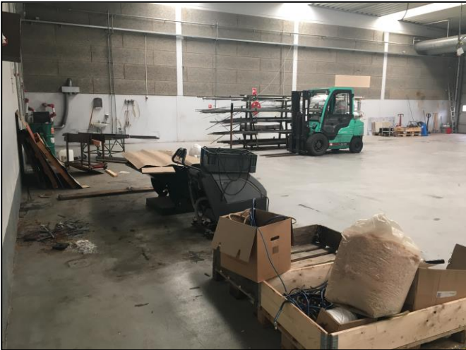
Foto af produktionslokalerne, hvor der nu kun er oprydningen tilbage.