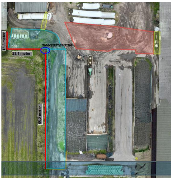
Figur 3. Rød strek viser, hvor væg til plansilo ønskes etableret.

Gule områder på figur 1 og 2 viser, hvor de ny plansiler skal placeres, og rød strek på figur 3 viser hvor væg til plansilo ønskes etableret.