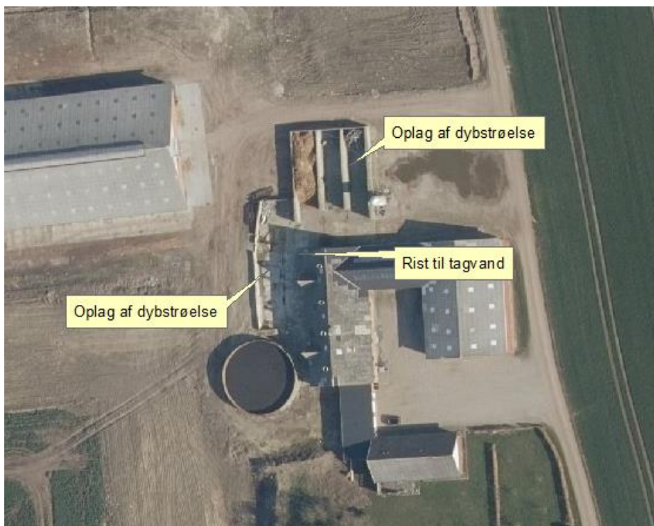
Figur 2. Steder for fremtidig opbevaring af dybstrøelse skal godkendes i en ny miljøtilladelse.