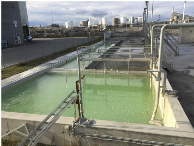
Figur 1, Slamkar