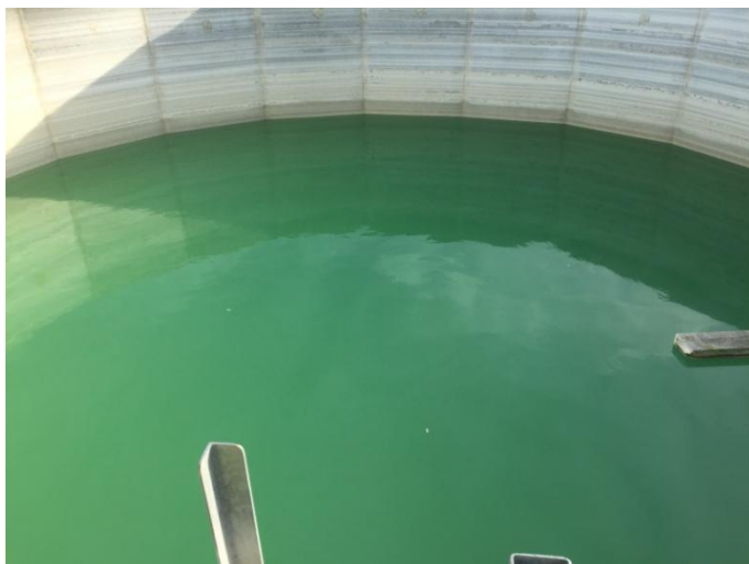
Figur 3, Stor vandtank (420 m3)