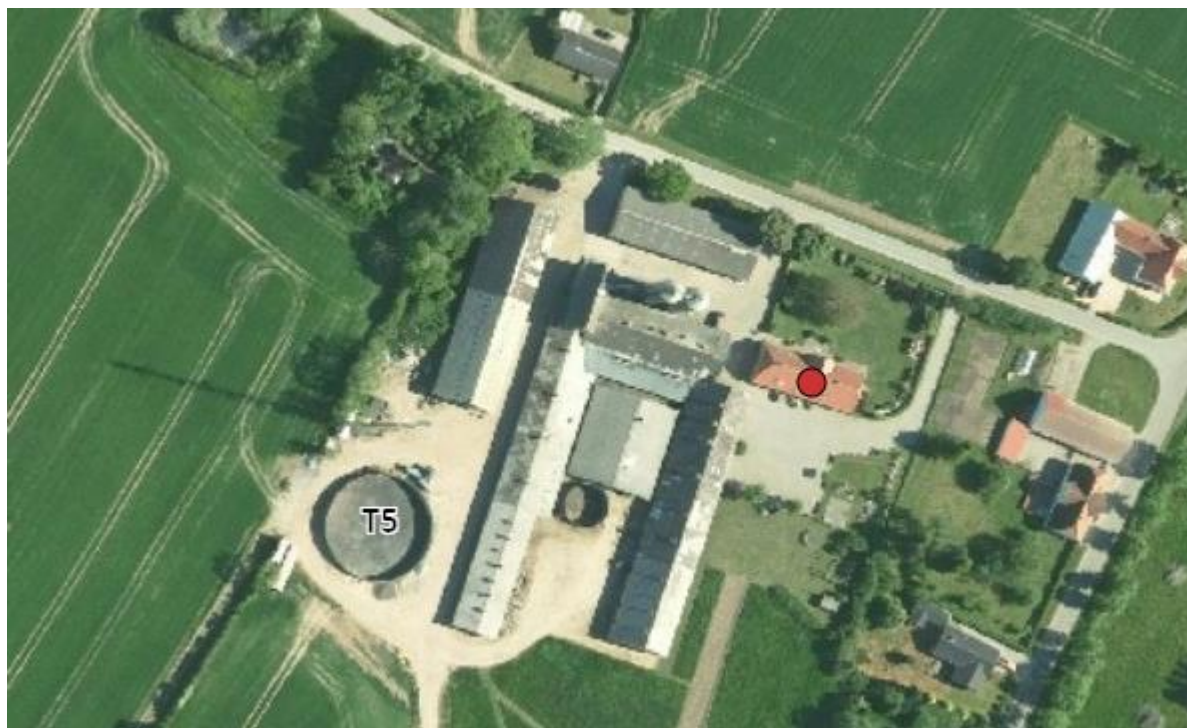
Figur 1. Oversigtskort over Hvinderupvej 3

Der er et ønske om at etablere en fast overdækning på den største af de eksisterende gyllebeholdere på ejendommen. Beholderen på 2.580 m 3 fra 1991 (T5 jf. BBR) er placeret i tilknytning til eksisterende bygningsmasse vest for ejendommen (jf. figur 1).