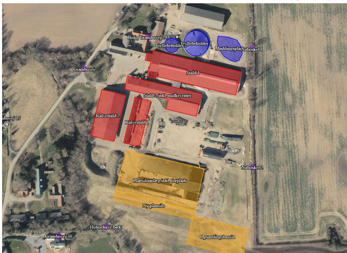
Figur 1: Oversigt over staldbygninger (rødt), gødningslagre (blåt) og øvrige anlæg (gul) på Grambovej 24, 5690 Tommerup.

Det samlede produktionsareal for det ansøgte staldanlæg er på i alt 4.545 m 2 . Placeringen af produktionsarealet fremgår af figur 1 (rødt).