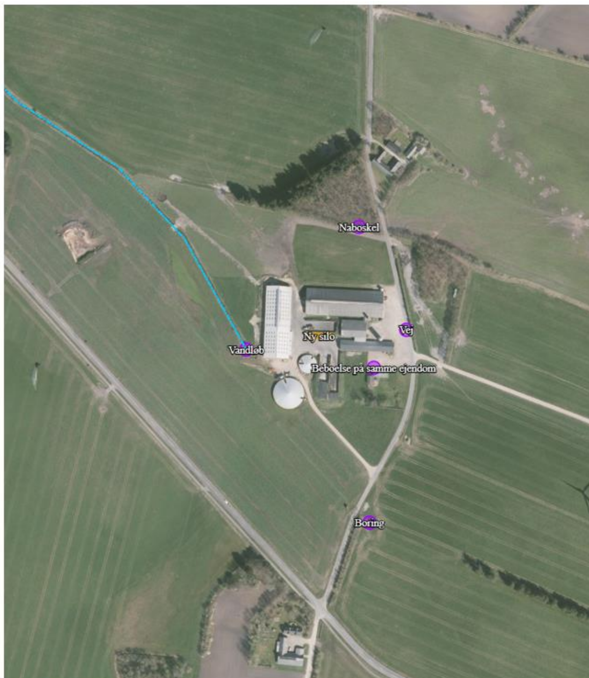
Figur 2. Placering i landskabet.