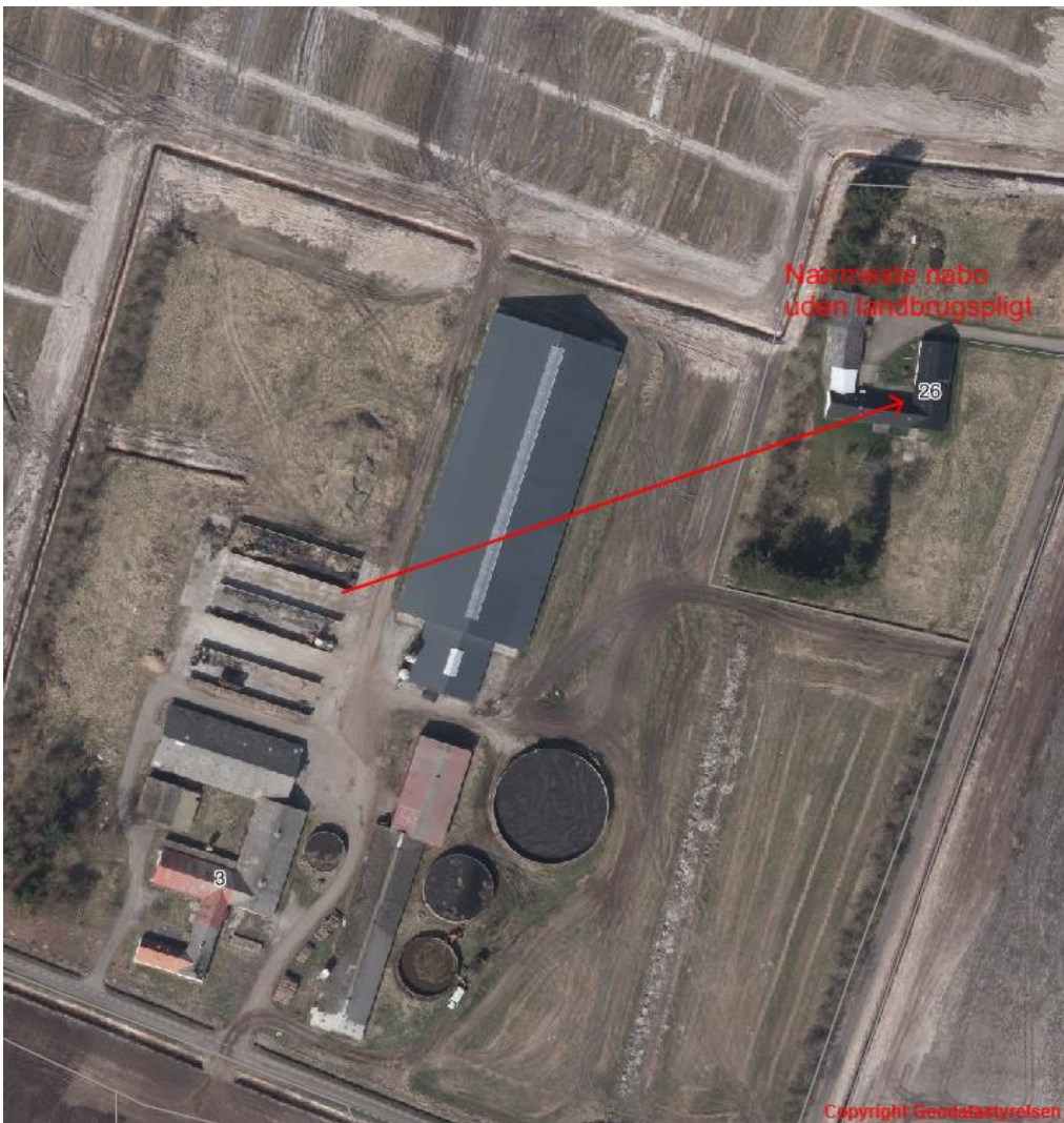
Figur 2 – Nærmeste naboer til husdyrbruget med landbrugspligt.

Som det ses af Tabel 4 4, overholder den ansøgte produktion lovens minimumskrav til lugtgeneafstande til de forskellige typer af beboelser i området.