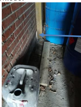
Revne til det fri

I et skur ved siden af klargøringsbygningen stod der tønder med fortynder. Tønderne stod på en betonplads med opkant. Kanten var ikke tæt, idet der var en revne i soklen ud til det fri. Se nedenstående billede.