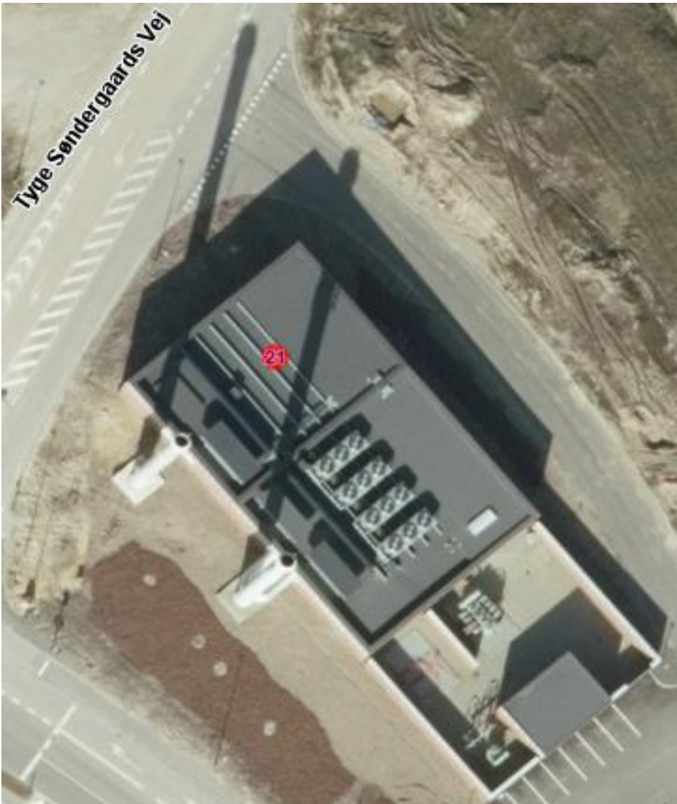
Luftfoto af virksomheden med tilhørende 2 skorstene på 34 meter

Nødstrømselværket er placeres indenfor kommuneplanens rammeområde 140807OF, der er udlagt til offentlige formål i form af sygehus og sygehusrelaterede funktioner. Området er omfattet af lokalplan nr. 887 Område til sygehus og sygehusrelaterede funktioner og forskerpark m.m. i Skejby. De nærmeste arealer anvendes til parkerings- og trafikarealer til hospitalet.