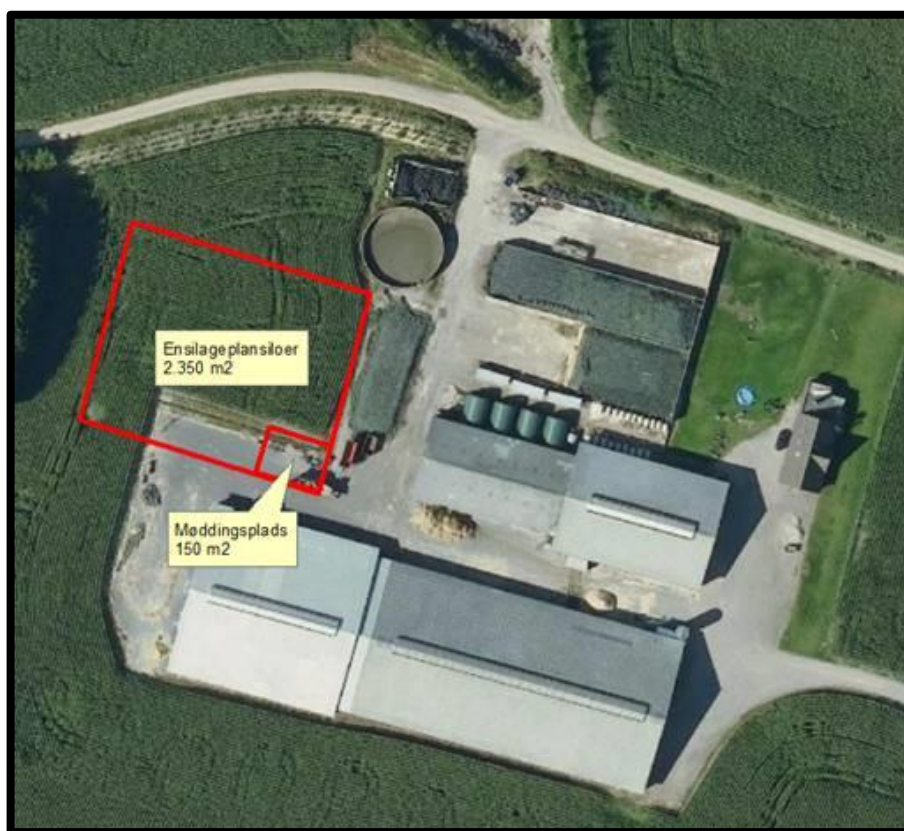
Figur 1. Ensilageplansilo og møddingsplads som godkendt i MGK2021.

Varde Kommune traf i MGK2021 afgørelse om, at der på Sdr Bjalderupvej 1, 6870 Ølgod blandt andet kan etableres et nyt plansiloområde på 2.350 m 2 og en møddingsplads på 150 m 2 , se figur 1.