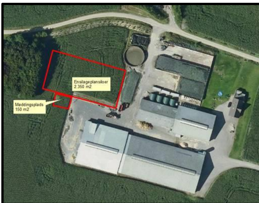
Figur 2. Ny ønsket placering af plansiloområde.