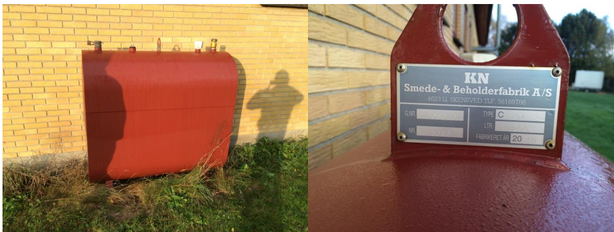
Overjordisk olietank til fyringsolie.