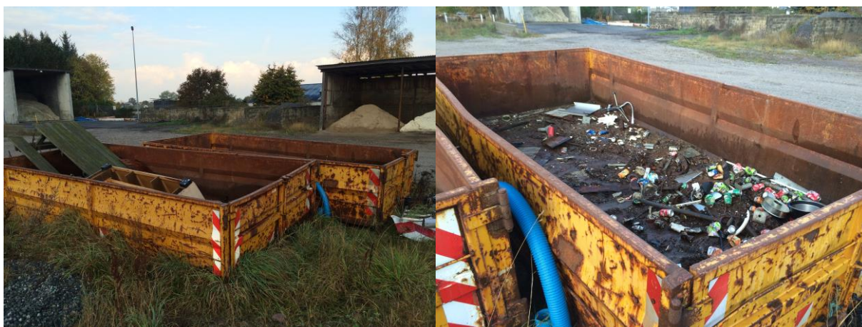
Containere til metal og træaffald.

Container med træaffald og container med metalaffald samt almindelig dagrenovation fra velfærdsbygninger. Dagrenovation bortskaffes til forbrænding og træ samt metalaffald bortskaffes til Reno Djurs i Glatved.