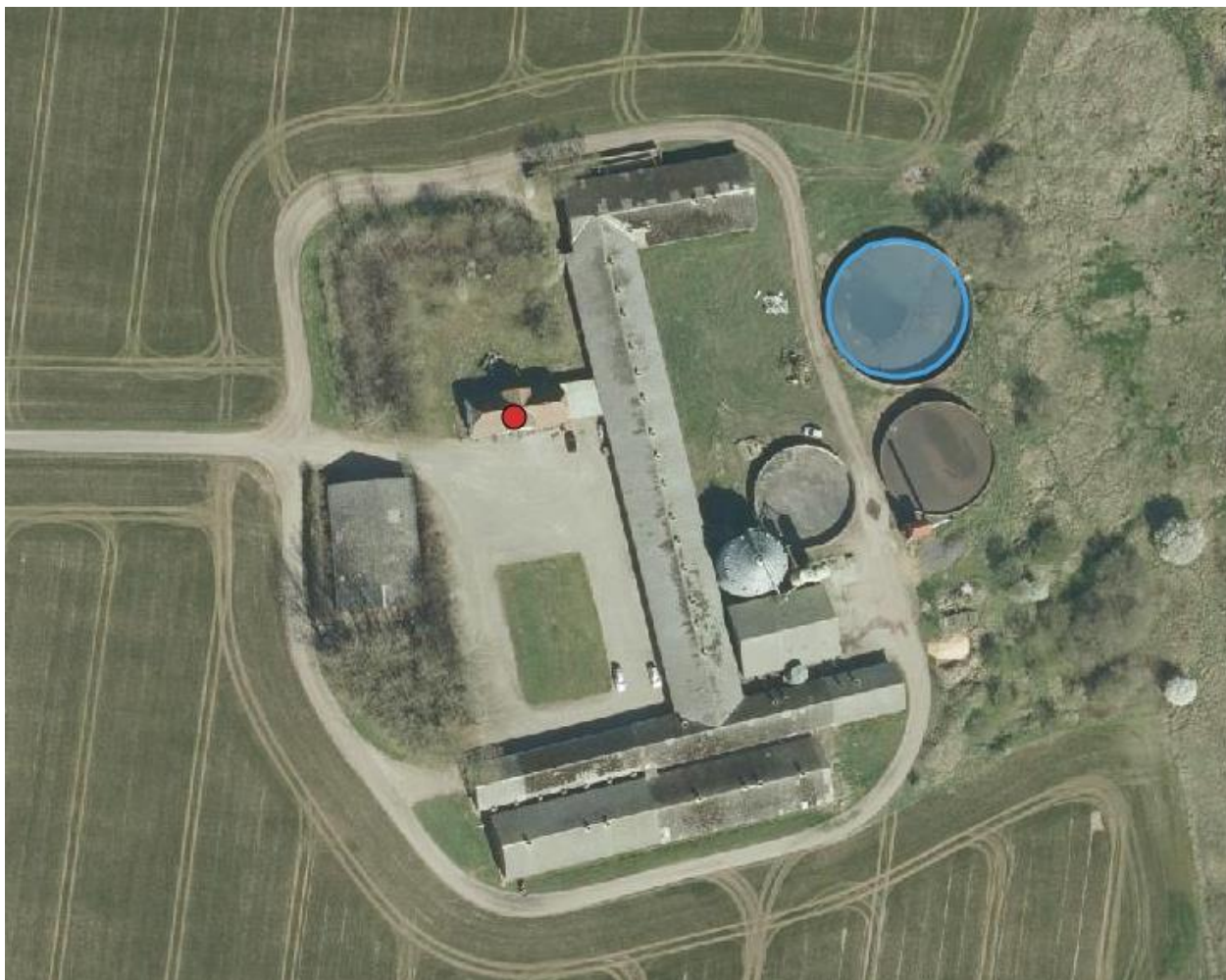
Figur 1. Oversigtskort over Nørremarksvej 6 med angivelse af den gyllebeholder, hvor teltdugen skal på.

med teltdug får en total højde over terræn på ca. 7 meter m. Arealet af gyllebeholderen vil fortsat være ca. 710 m 2 .