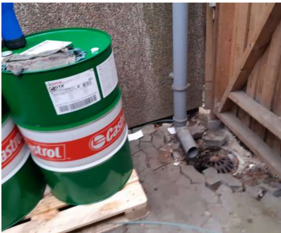
Regnvandsbrønd ved siden af olieopbevaring