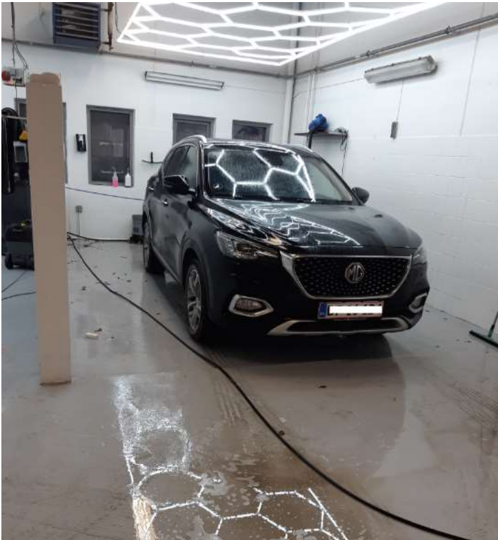
Indendørs vaskeplads til biler