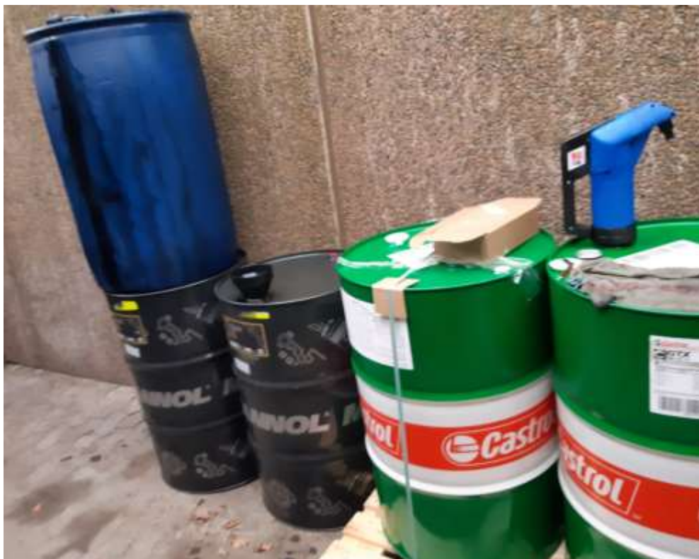
Spildolie og oliefiltre i blå og sorte tromler. Ny olie i grønne tromler