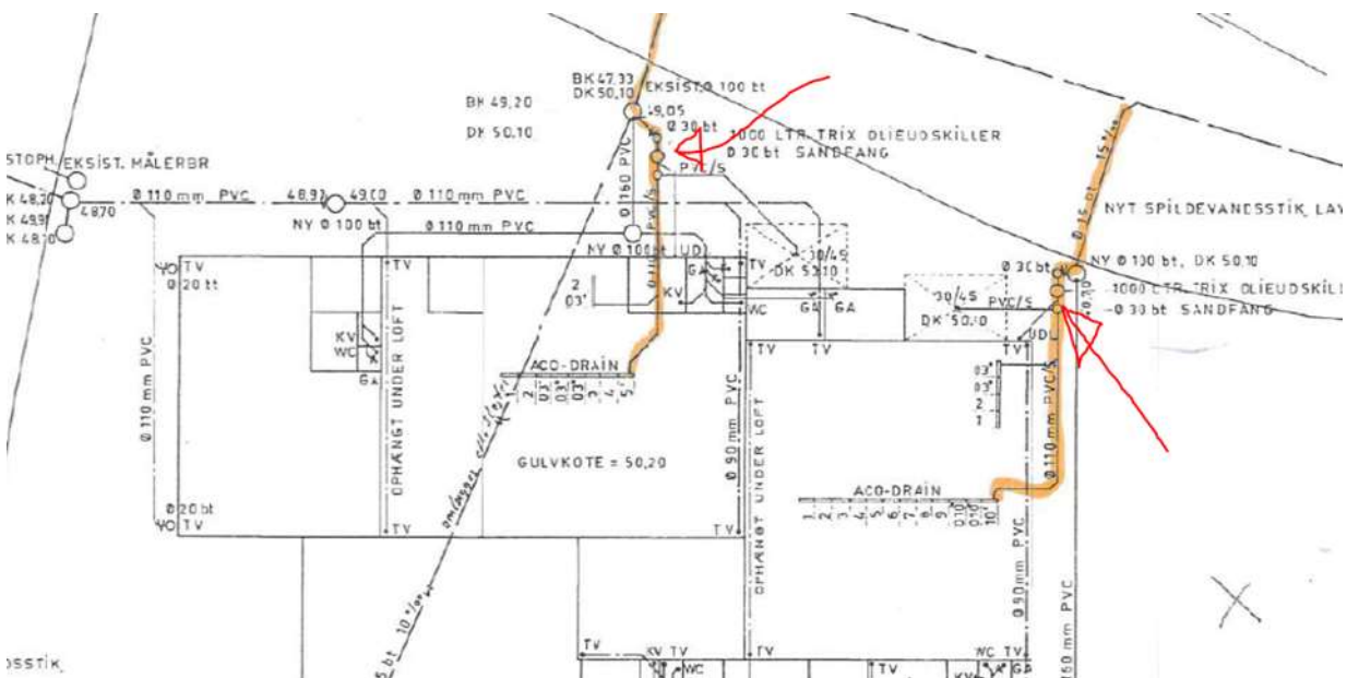
Skitse med placering af olieudskillere

Du vil finde ud af om det er dig eller udlejer, der skal stå for tømning af olieudskillerne. Du skal melde tilbage til mig inden den 31. februar 2024 hvem, der har ansvaret for den. Hvis du er den ansvarlige, skal du senest den 1. april 2024 kontakte Alfa Specialaffald (tlf. 54 88 11 00) og aftale tømning af dem så snart Alfa har tid.