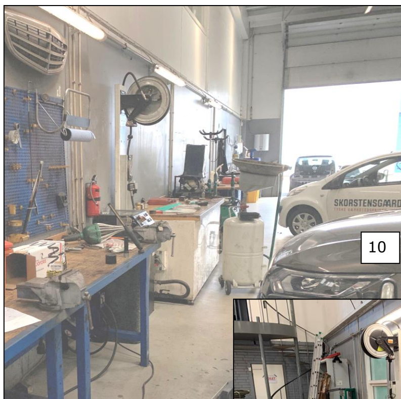
Værkstedslokale med olietank på vestsiden foto 10 og østsiden foto 11.

Tankene til motorolie er ikke registreret i BBR, hvilket er tjekket på www.ois.dk