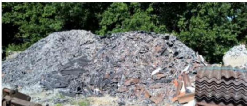
Knuste tagplader: sørg for dokumentation/analyse af, at tagpladerne ikke indeholder asbest!

Skal du udvide, renovere eller rive din ejendom ned, gælder der særlige bestemmelser for håndtering, sortering og bortskaffelse af bygge- og anlægsaffald, herunder tagplader med og uden asbest.