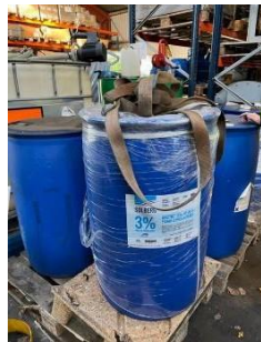
SOLBERG ARCTIC™ 3% AFFF