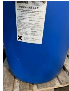
Orchidex ME 3% F