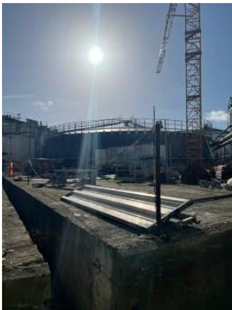
Bygning af Tank 4

Virksomheden har planer om at ansøge om midlertidige vilkårsændringer for vilkår B20 vedrørende renovering af Tank 8 og Tank 9, og ønsker at etablere en stormsikringsport som kan åbnes om dagen og anvendes til kørsel ind og ud fra hovedgaden.