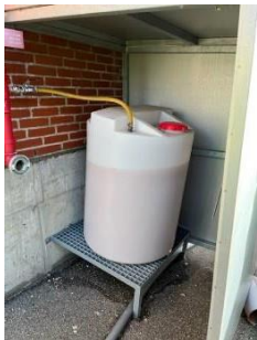
SOLBERGARCTIC™ 3% AFFF

Brandslukningsanlægget indeholder SOLBERG Re-healing 1%, som står indendørs. Der er også oplag af STHAMEX 3% F-15, SOLBERG Arctic 3% og Orchidex ME 3% i lagerhallen. Der er oplag af SOLBERG Arctic 3% i en skumtank, der står udenfor bygningen port 16, hvor rørforbindelse går ind til bygningen. Der skal brandskummet anvendes i tilfælde af brand.