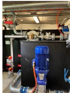
SOLBERG 1% RE- HEALING