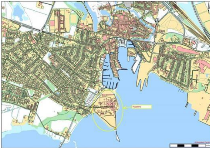
Figur 1 Oversigtskort over placering af Koppers Denmark