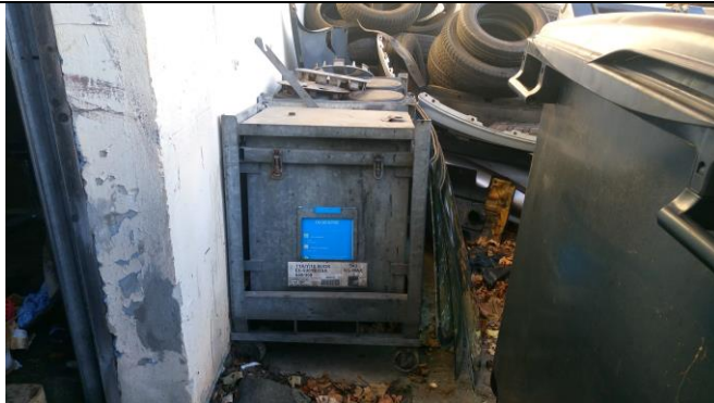
Billede nr. 3: ABAS-beholdere med oliefiltre og bl.a. køler- og bremsevæske er placeret udendørs på beton (2016)