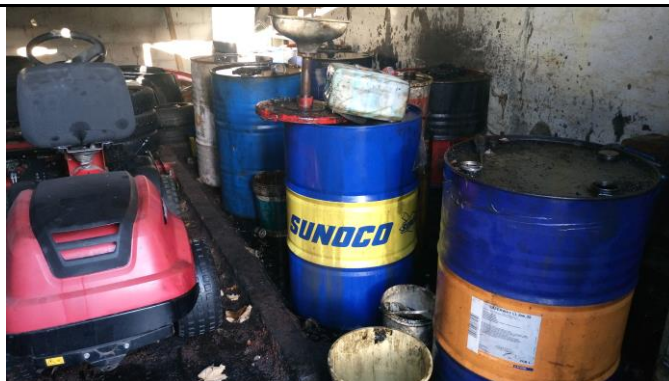
Billede nr. 4: Spildolie på toppen af olietønderne og gulvet på oplagspladsen. (2016)