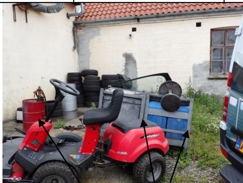
Billede nr. 1: Henstilling af beholdere med farligt affald og tromle med olie (2015).