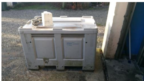
Billede nr. 6: Beholder til batterier m låg (2016)