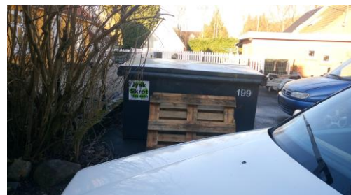
Billede nr. 7: Container til jernskrot. (2016)