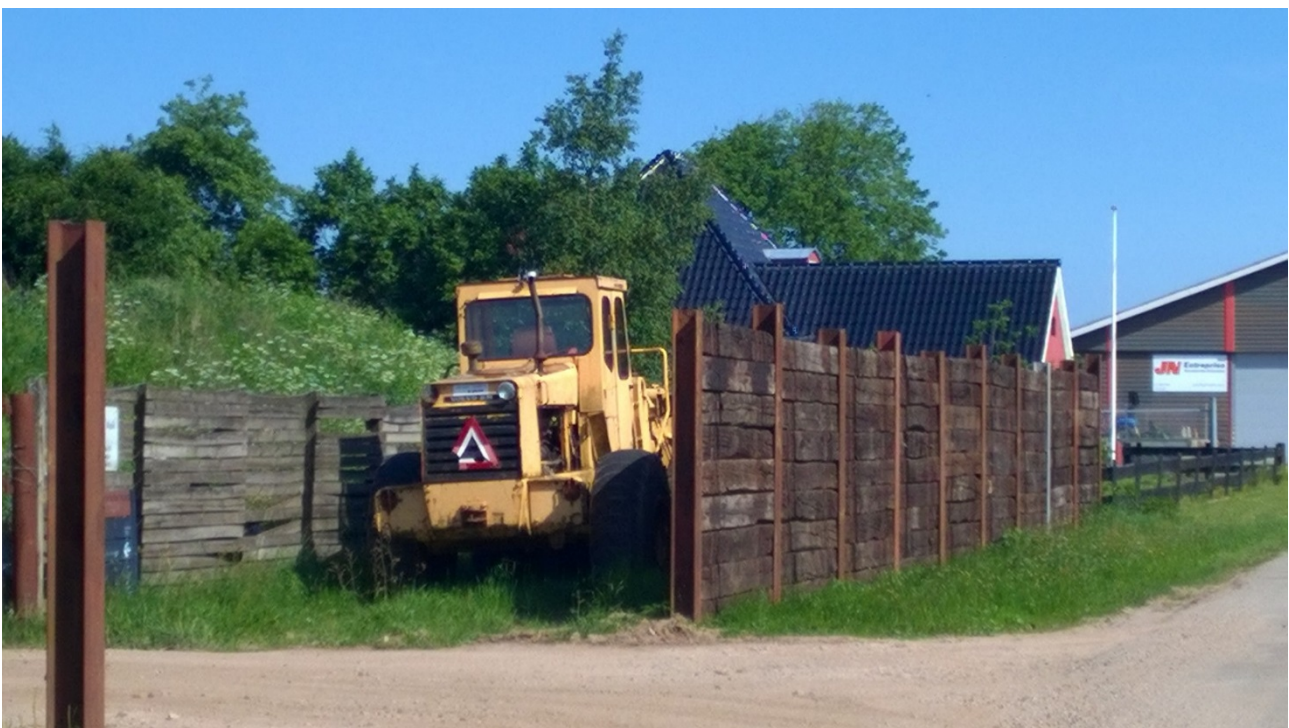
Figur 2Hegnet tæt på.

I og med at det er Miljøstyrelsen som er tilsynsmyndighed ved genanvendelse af jernbanesveller, tog Billund Kommune kontakt til Miljøstyrelsen.