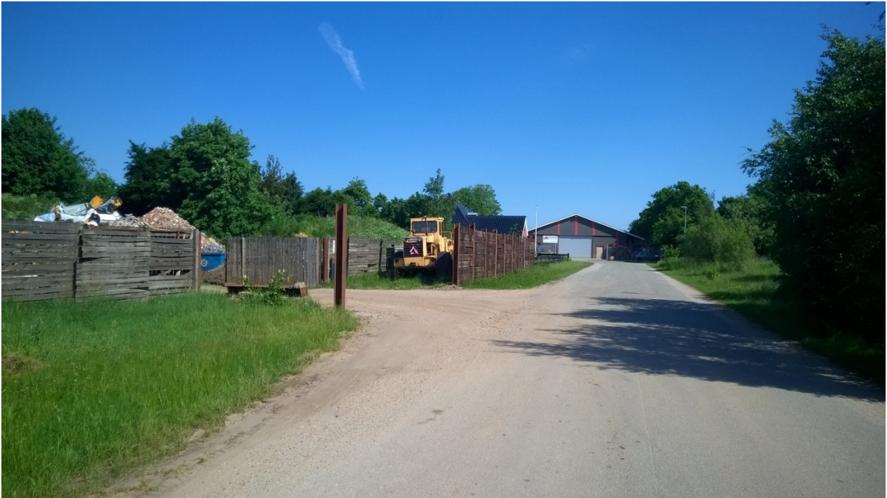
Figur 1Foto af det eksisterende hegn 3. juni 2016. Hegnet skal forlænges hen mod fotografen.