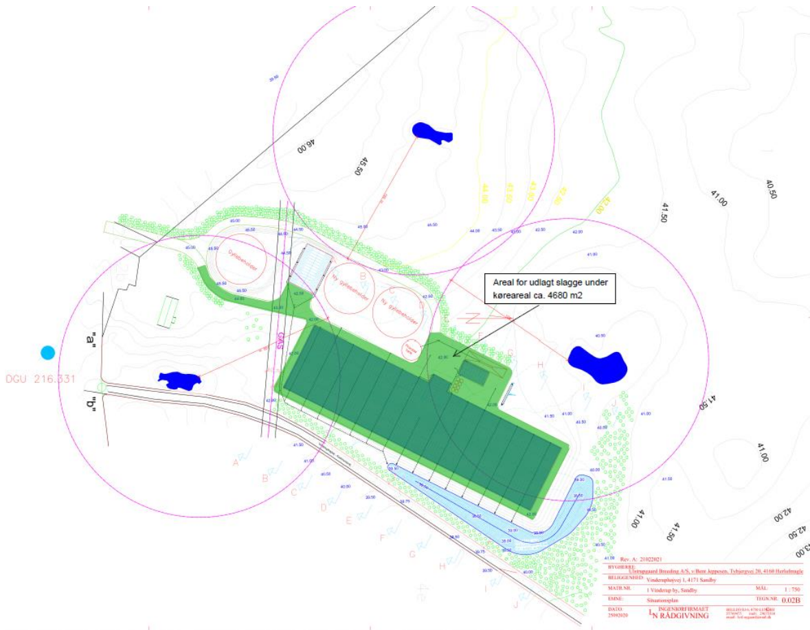
Bilag 1b Målsat plan asfalteret areal