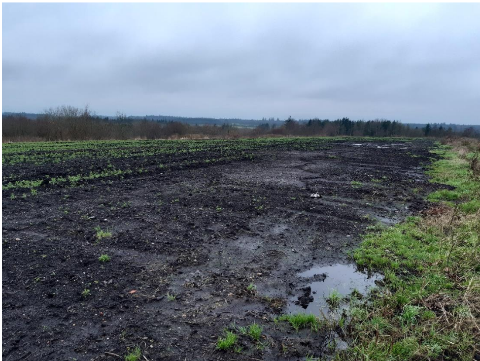
Figur 1: Overflade af slutaafdækning på enhederne 15-20