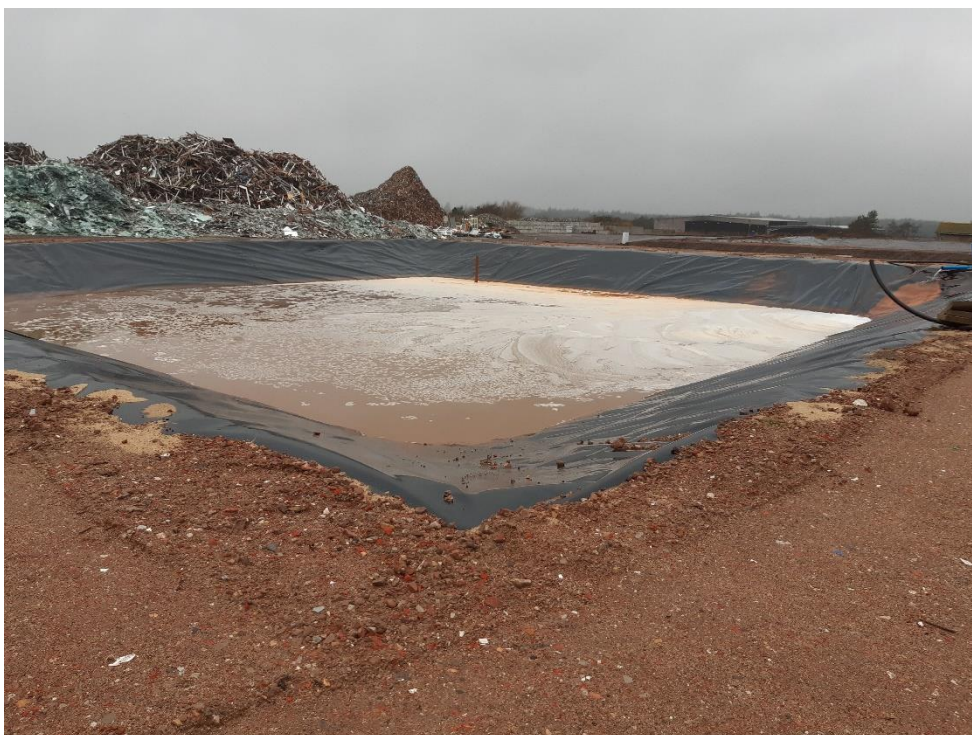
Figur 2: Lagune 1 fotograferet mod sydvest.