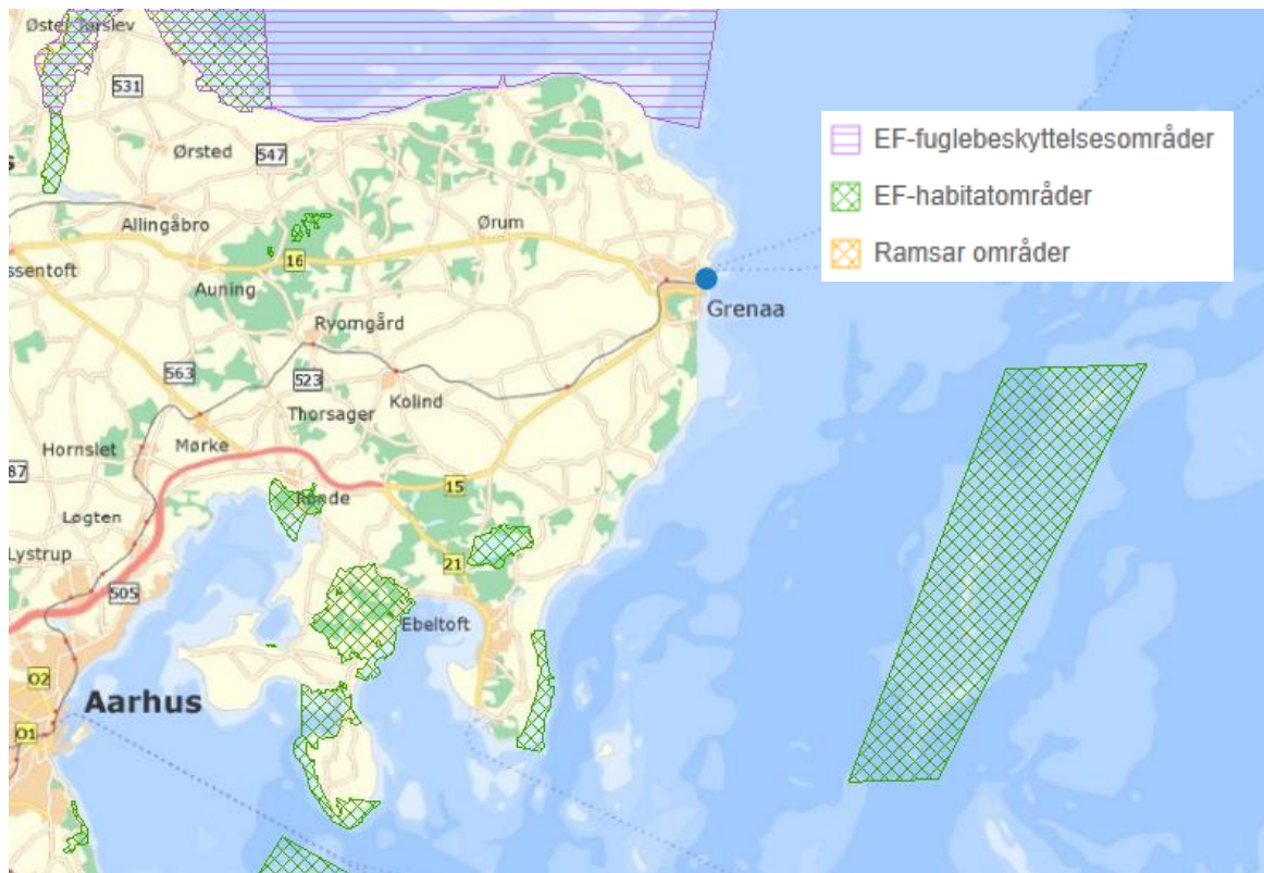
Figur 1. Oversigtskort over Natura 2000-områder