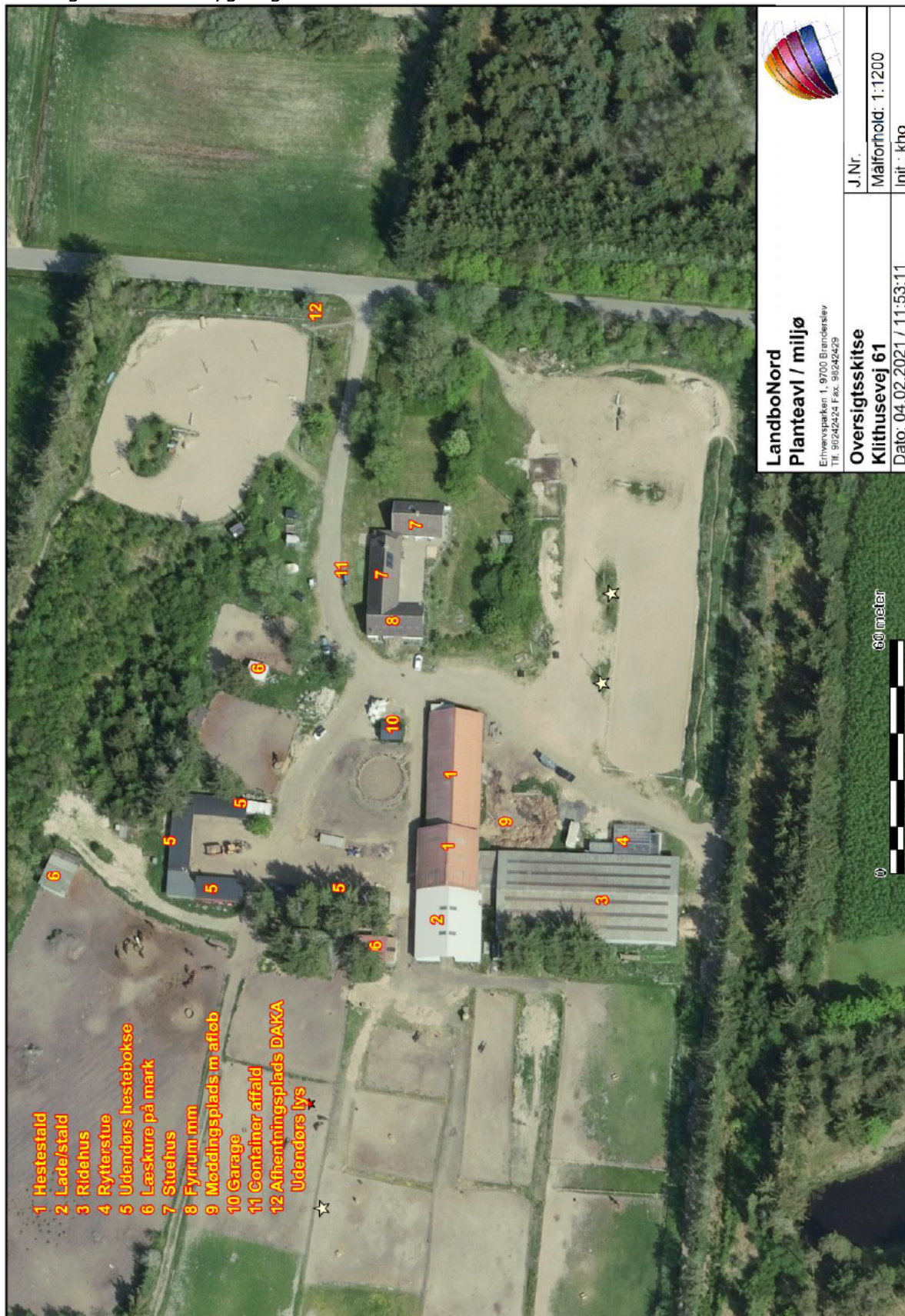
Oversigtskort over bygningerne