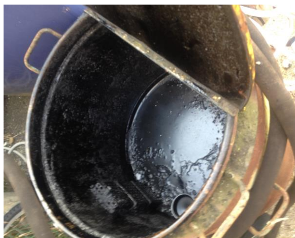
Billede 2. Beholder med ukendt indhold af tykt flydende kemikalie