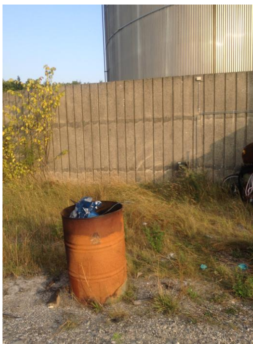
Billede 1. Olietønde med afbrændt affald

Ved tilsynet den 13. september 2016 blev der konstateret, at der ikke var nogen af forholdene fra sidste tilsyn der var blevet bragt i orden. Der blev ved tilsynet endvidere observeret en olietønde med afbrændt affald (billede 1) samt en beholder med ukendt tykt sort kemikalie (billede 2). Der blev herudover observeret, at der dryppede væske fra én af rørføringerne/samlingerne i tankgården længst mod sydvest (Billede 3).