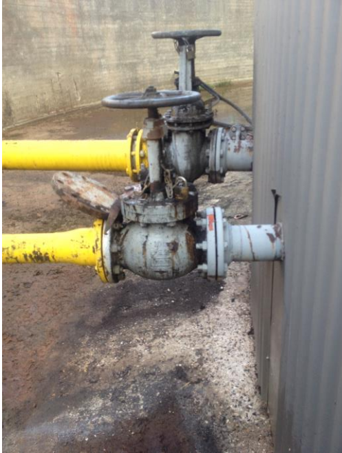
Billede 3. Samlingen i forbindelse med rørføringen, som er tættest på kameraet er utæt. Der var oliefilm på tankgårdens bund og vandpytter.