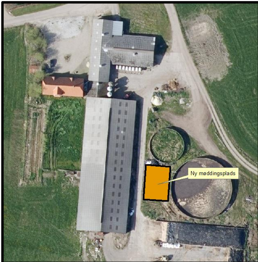
Figur 2. Ny møddingsplads

Varde Kommune vurderer at indretningen er tilstrækkelig beskrevet.