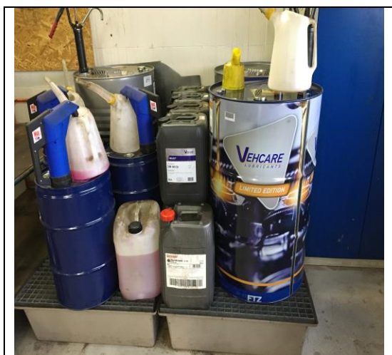
Opbevaring af råvare

Råvare står i råvarerum med tæt beton på riste med opsamling under.