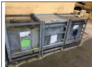
Opbevaring af affald

Årsrapport for 2019 er modtaget. Og vedlagt i bilag.