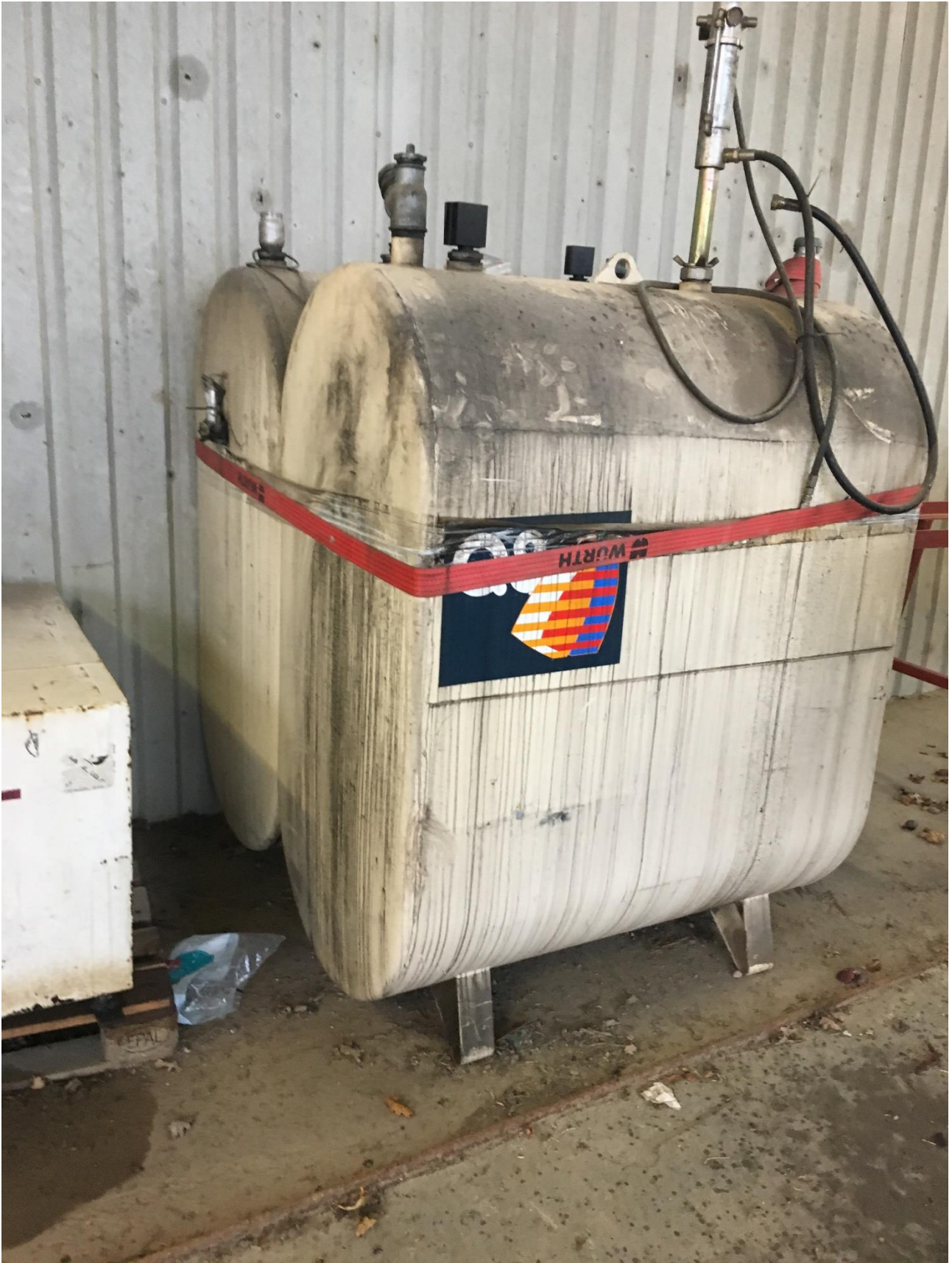
2 flytbare ved vaskeplads. Venligst oplys årstal og serienummer på tankene.