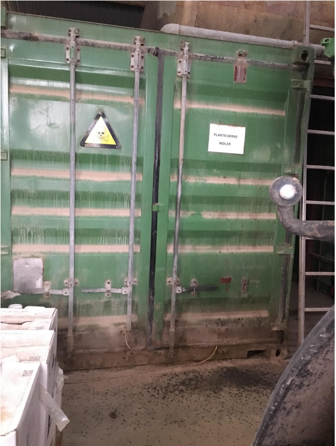
Opbevaring af kemikalier, giftstoffer mv. sker i aflåst container i hal.