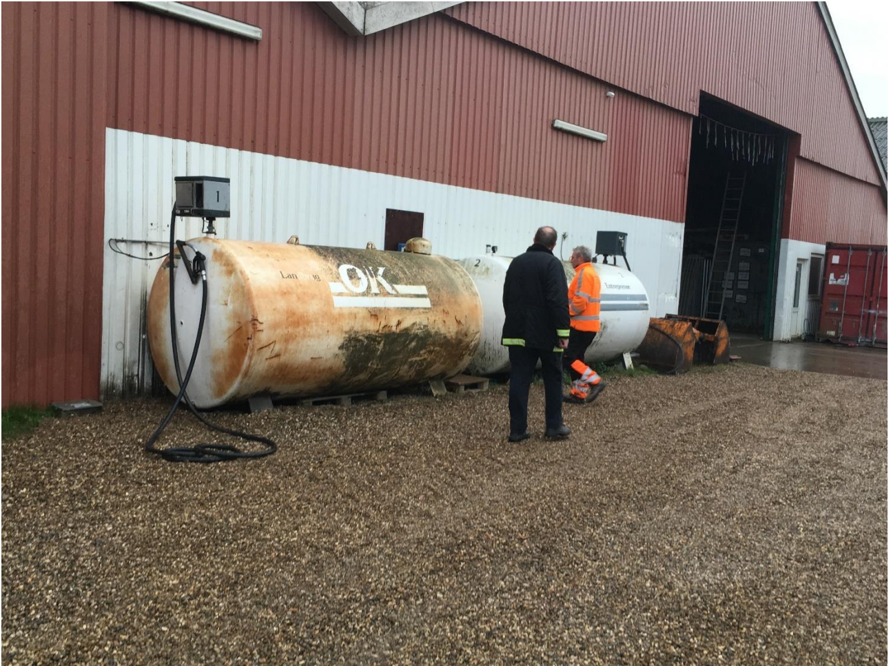
Virksomhedens køretøjer fyldes med dieselbrændstof fra 2 tanke placeret på ubefæstet areal.