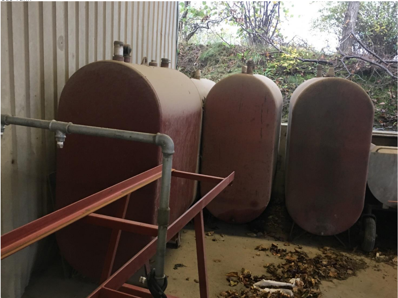
4 tomme tanke på vaskeplads- venligst fremsend tankoplysninger på tankene til BBR hvis de stadig bruges.