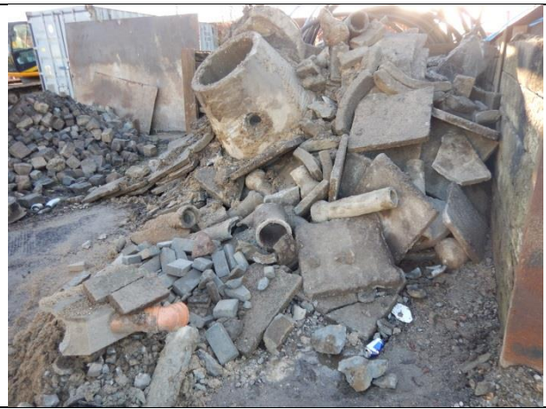
8. Oplag af beton.