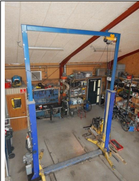
1. Værksted hvor der serviceres plæneklippere og mindre materiel.