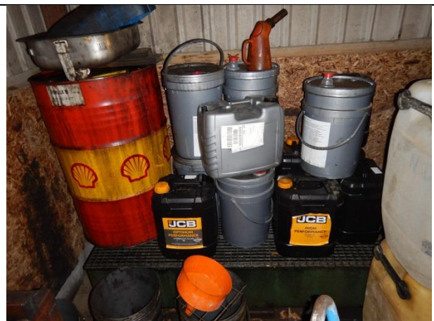
4. Opbevaring af farligt affald på spillbakke.