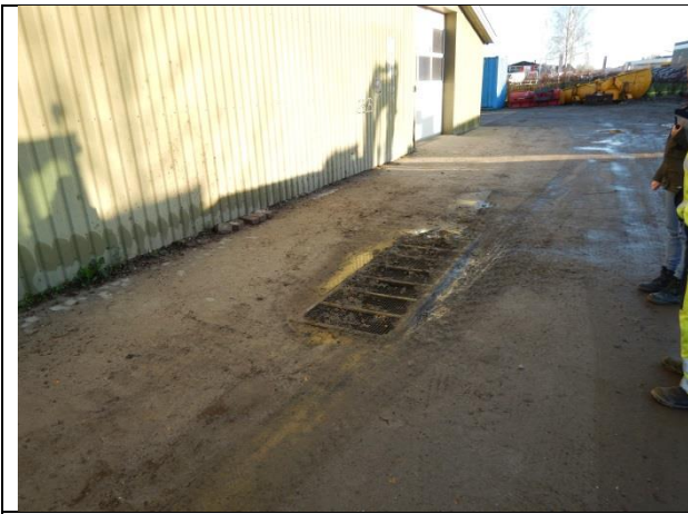
7. Udendørs vaskelads.