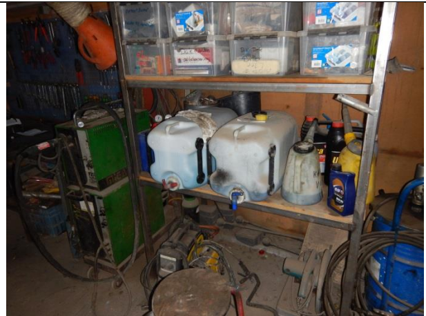
2. Opbevaring af nye produkter.