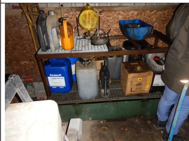
5. Opbevaring af farligt affald på spillbakke.