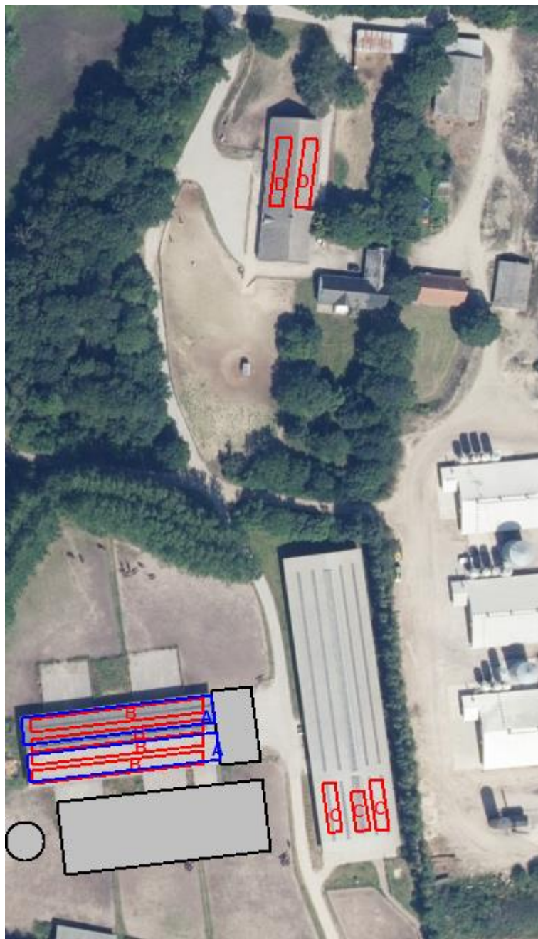
Oversigt over produktionsareal. Blå = Forhenværende produktionsareal i den eksisterende løsdrift stald. Rød = Ansøgt drift.